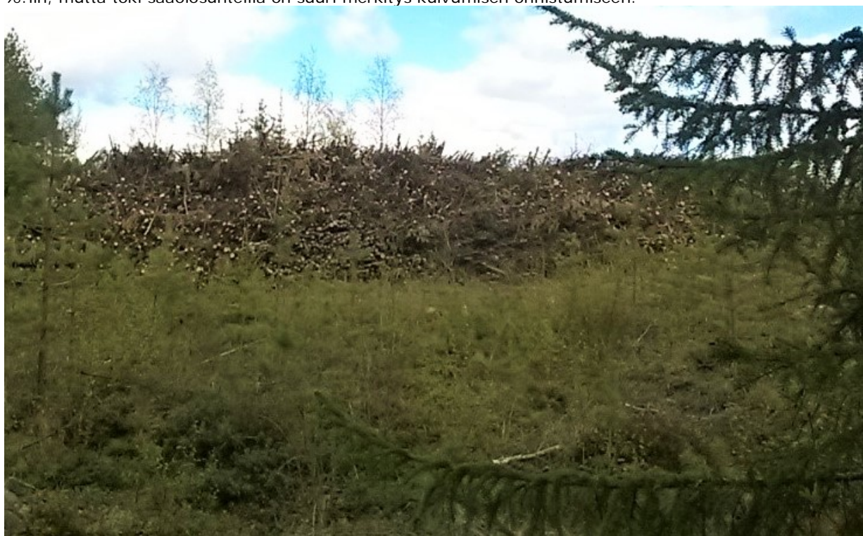
KUVA 2. Energiapuun kuivumista edistää varastointi aurinkoiselle ja tuuliselle paikalle

Myös energiapuun luonnonkuivaus kannattaa hyödyntää (kuva 2), sillä luonnonkuivauksella energiapuun kosteuspitoisuutta saada huomattavasti laskettua verrattuna kaatotuoreen puun kosteuspitoisuuteen. Luonnonkuivauksella saadaan hakkeeksi käytettävän energiapuun kosteuspitoisuus parhaimmillaan jopa 30 %:iin, mutta toki sääolosuhteilla on suuri merkitys kuivumisen onnistumiseen. [9] [10]