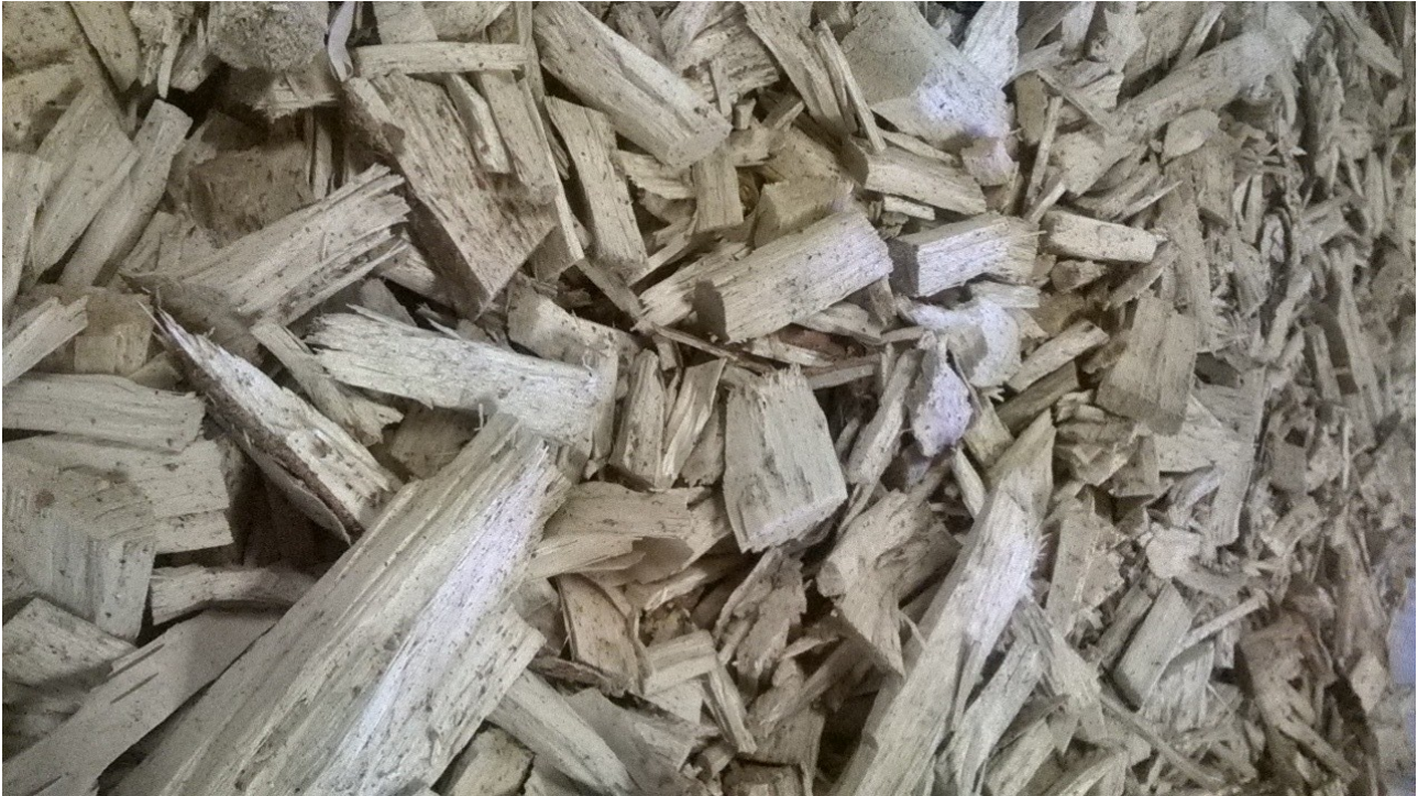
KUVA 1. Tuoreesta koivurangasta valmistettua haketta

Hake kuivattiin lavakuivurilla. Kuivurin pohjassa on käytetty suomulevyä, jonka läpi kuivausilma puhalletaan kuivuriin keskipakoispuhaltimella. Keskipakoispuhallin toimii 2,2 kilowatin sähkömoottorilla. Kuivuriin on liitetty taajuusmuuntaja, jolla puhaltimen kierrosnopeutta voidaan säätää. [12] Puhaltimen kierrosnopeutena käytettiin 35 herziä. Kuivausilmaa lämmitettiin kuivuriin liitetyllä teholtaan yhdeksän kilowatin sähkölämmittimellä. Sähkölämmittimessä on portaaton säätö ja se asetettiin puolelle teholle. Sähkölämmittimen asetukset pidettiin kaikissa kuivauksissa samana.