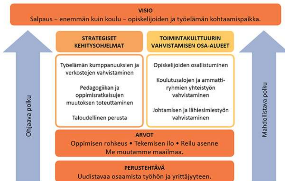
Kuva 1. Koulutuskeskus Salpauksen strategiakokonaisuus 1.1.2016 alkaen (Koulutuskeskus Salpaus 2017)

Osana strategiaprosessia on määritelty tavoiteltava toimintakulttuuri. Salpauksen tavoitteena on yhteisöllisen toimintakulttuurin rakentaminen . (Koulutuskeskus Salpaus 2017.)