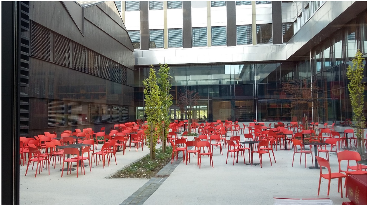
BUC, Kronstadin kampus, Kirjaston sisäpiha.

Esitelmien ja ryhmätöiden lisäksi tutustuimme viikon aikana Bergen University Collegen tutkimuslaboratorioihin ja tutkimukseen, Bergenin yliopiston kirjastoon sekä Kronstadin kampuksen oppimisympäristöihin.