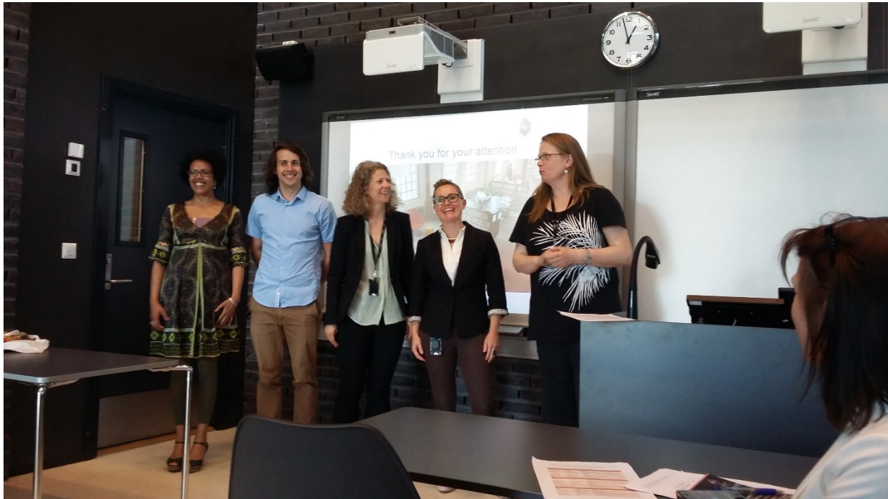
Bergen University College, kirjaston tutkimuksen palveluiden henkilökuntaa ja kv-yhteyshenkilö.

Osallistuin Bergen University Collegen (BUC) kirjaston järjestämälle kv-viikolle 9.-13.5.2016, jona aiheena olivat kirjaston tarjoamat tutkimuksen palvelut (Erasmus Staff Mobility Week "Research Support from Library" http://www.hib.no/en/library/erasmus-staff-week ). Viikkoa emännöi BUC:in kirjaston tutkimuksen palveluiden henkilökuntaa: