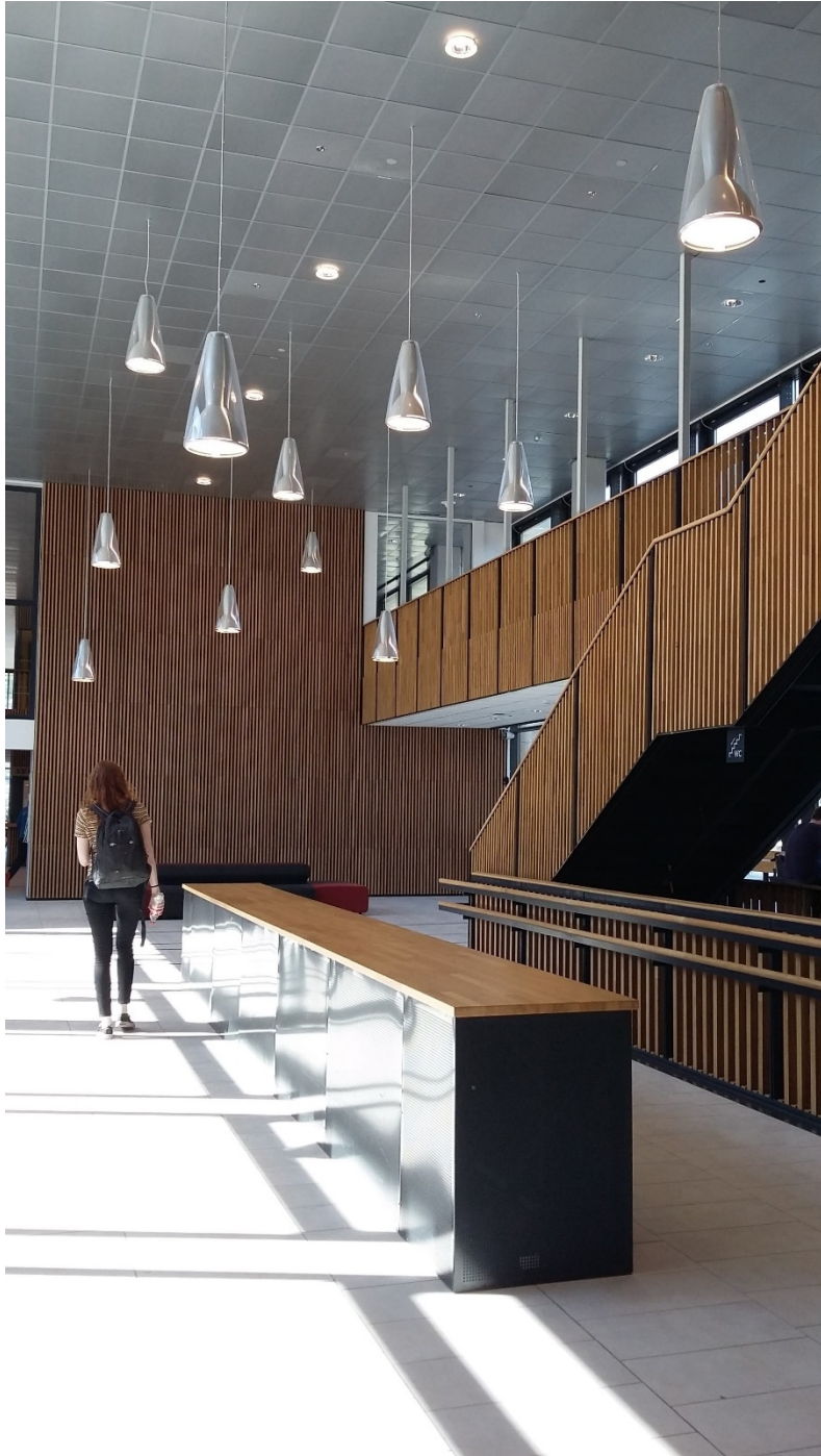
BUC, Kronstadin kampuksen aula.