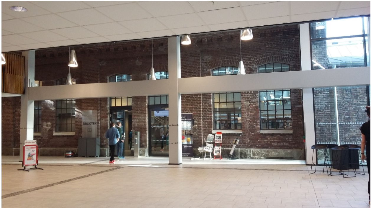
BUC, Kronstadin kampuksen kirjaston sisäänkäynti.