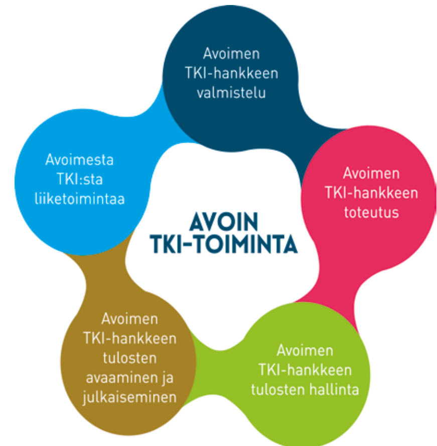
Kuva 1. Avoimen TKI-toiminnan prosessi ammattikorkeakouluissa (Päällysaho & Latvanen 2017).

Ammattikorkeakoulujen avointa TKI-toimintaa voidaan tarkastella jatkumona (ks. Kuva 1), jonka viisi päävaihetta ovat: 1. TKI-hankkeen valmistelu, 2. TKI-hankkeen toteutus, 3. TKI-hankkeen tulosten hallinta, 4. TKI-hankkeen tulosten avaaminen ja julkaiseminen sekä 5. TKI:sta liiketoimintaa. Kaikissa prosessin vaiheissa on mahdollista toimia avoimuutta edistävasti. (Päällysaho & Latvanen 2017.)