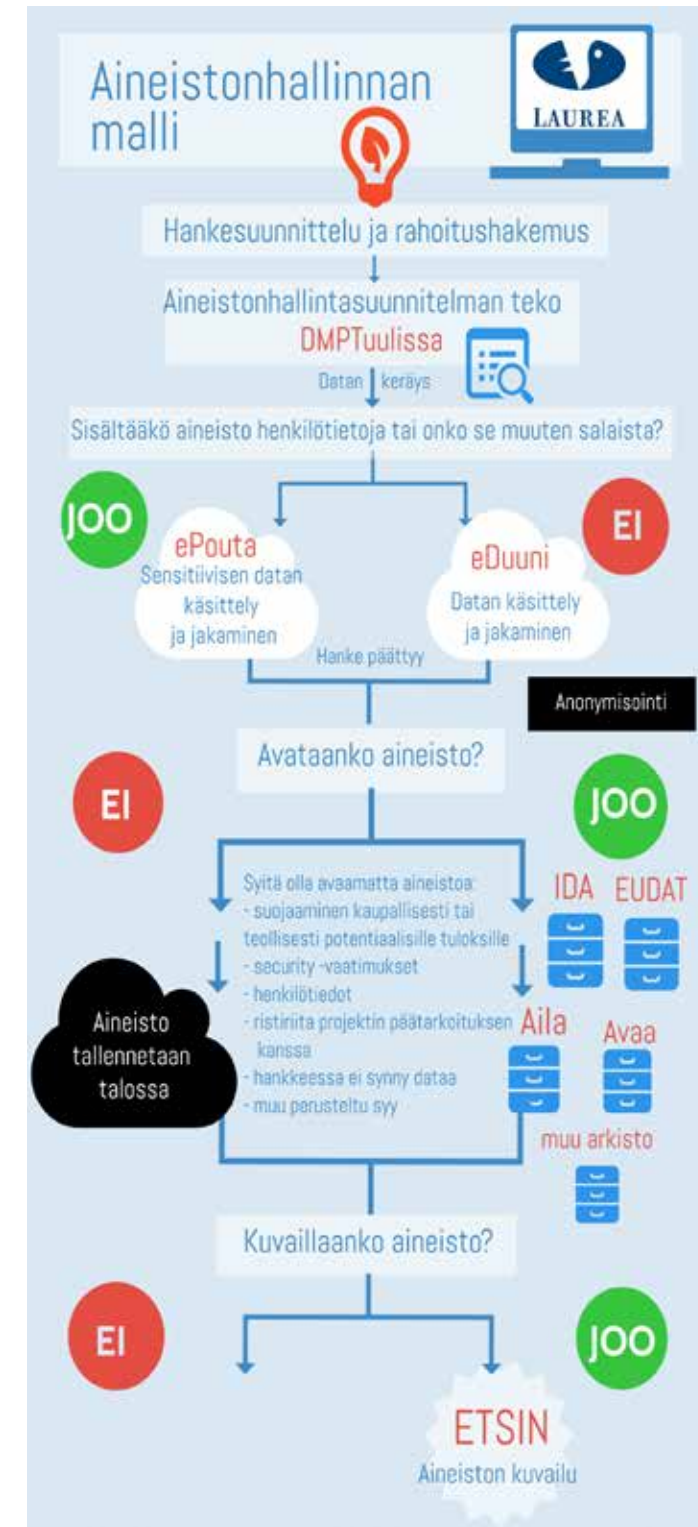
Kuva 2. Laurean aineistohallinnan malli.

Hankkeen valmistuttua tehdään päätös, avataanko aineisto. Jos se halutaan avata, henkilötietoja sisältävä aineisto anonymisoidaan ja se ladataan kansalliseen tai kansainväliseen arkistoon. Tärkeää on, että aineisto kuvaillaan kansalliseen ETSIN-palveluun, jotta aineisto olisi jatkokäytettävissä. Aineiston käytöstä voidaan määrittellä tarkemmin niin, että sen saa käyttöön suoraan arkistosta tai pyydetessä yhteyshenkilöltä.