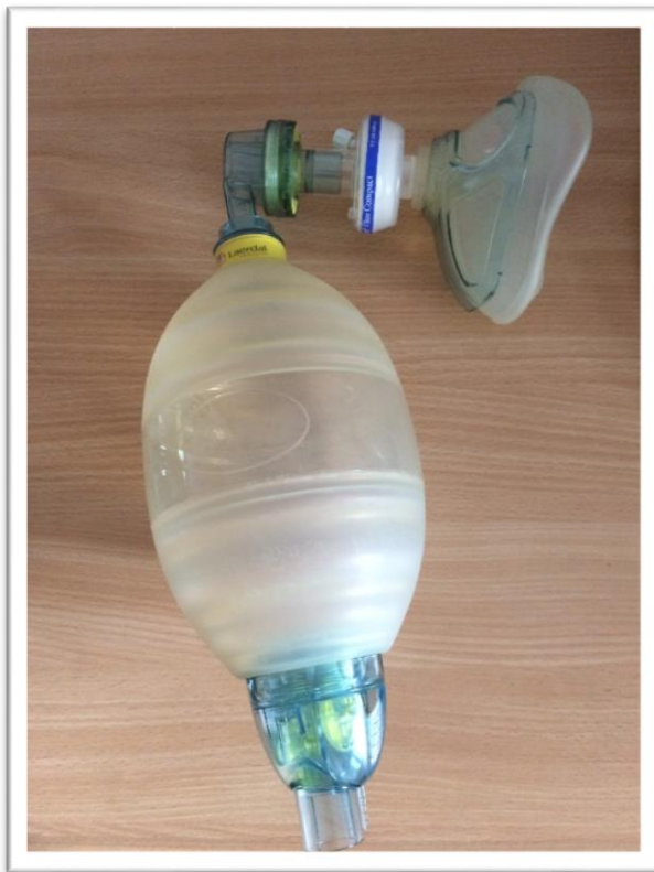
Kuva 1 Hengityspalje, johon kiinnitettynä maski ja venttiili

Hengityspalkeen (Kuva 1) avulla suoritettu air stacking tapahtuu niin, että henkilön sisäänhengitystä tehostetaan tuomalla lisää ilmaa keuhkoihin palkeen avulla. Jokaisen niin kutsutun insufflaation välillä potilasta ohjataan pitämään sisään vedetty ilma keuhkoissa. Näin saadaan tehostettua sisäänhengitystä aina maksimaaliseen täyttymiseen saakka. (Torres-Castro 2014, 355.) Mikäli henkilö ei pysty pitämään äänirakoaan suljettuna, voidaan palkeen uloshengitysventtiili sulkea. Tällöin LVR-menetelmä suoritetaan passiivisesti (Bach & Mehta 2014, 29).