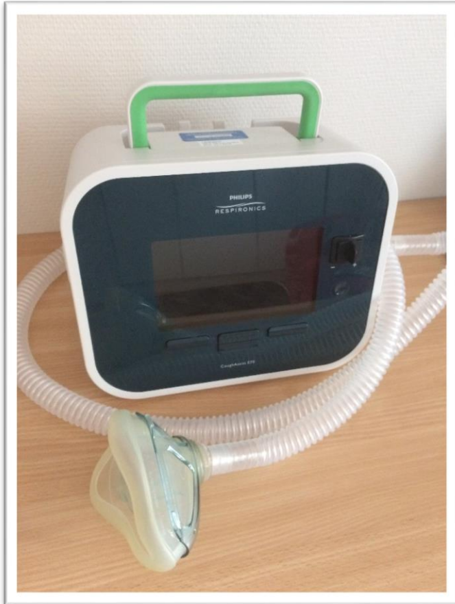
Kuva 2 Philips Cough Assist E70 -yskityslaite.