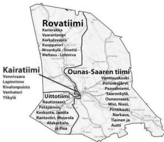
Kuva 1. Rovaniemen kaupungin kotihoidon tiimit alueittain. (Rovaniemen kaupunki 2012.)

Tutkimusluvan saatuaamme aloitimme aineiston keruun tammikuussa 2017. Ensimmäinen vaihe oli kotihoidon tiimien esimiesten tiedottaminen asiasta ja haastateltavien löytäminen. Laadimme saatekirjeen ja suostumuslomakkeen, joissa kerrottiin haastattelujen tarkoituksesta ja tavoitteesta sekä käytännön järjestelyistä. Kotihoidon työntekijät kertoivat asiakkailleen mahdollisuudesta osallistua haastatteluihin, pysivät kiinnostuneilta kirjallisen suostumuksen ja vähitellen saimme suostumuksia helmi-maaliskuun aikana. Suostumuksia saimme yhteensä kahdeksan, joista kaksi perui osallistumisensa myöhemmin. Soitimme haastateltaville ja sovimme jokaisen kanssa henkilökohtaisen haastatteluajan. Haastattelut tehtiin ikääntyneiden kotona ja nauhoitettiin myöhempää analysointia varten. Lisäksi haastattelujen nauhoittaminen antoi haastattelijalle mahdollisuuden keskittyä myös haastateltavan sanattomaan viestintään ja muuhun havainnointiin. Haastatteluissa ei ollut läsnä muita henkilöitä haastattelijoiden ja haastateltavan lisäksi.