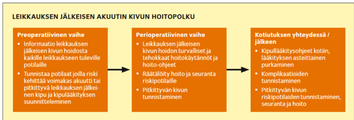
KUVIO 2. Leikkauksen jälkeisen akuutin kivun hoitopolku (Suomen anestesiologiyhdistyksen kivun hoidon jaoksen asettama työryhmä 2014)