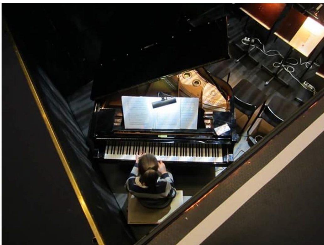
KUVA 4. Korrepetiittori työnsä äärellä.