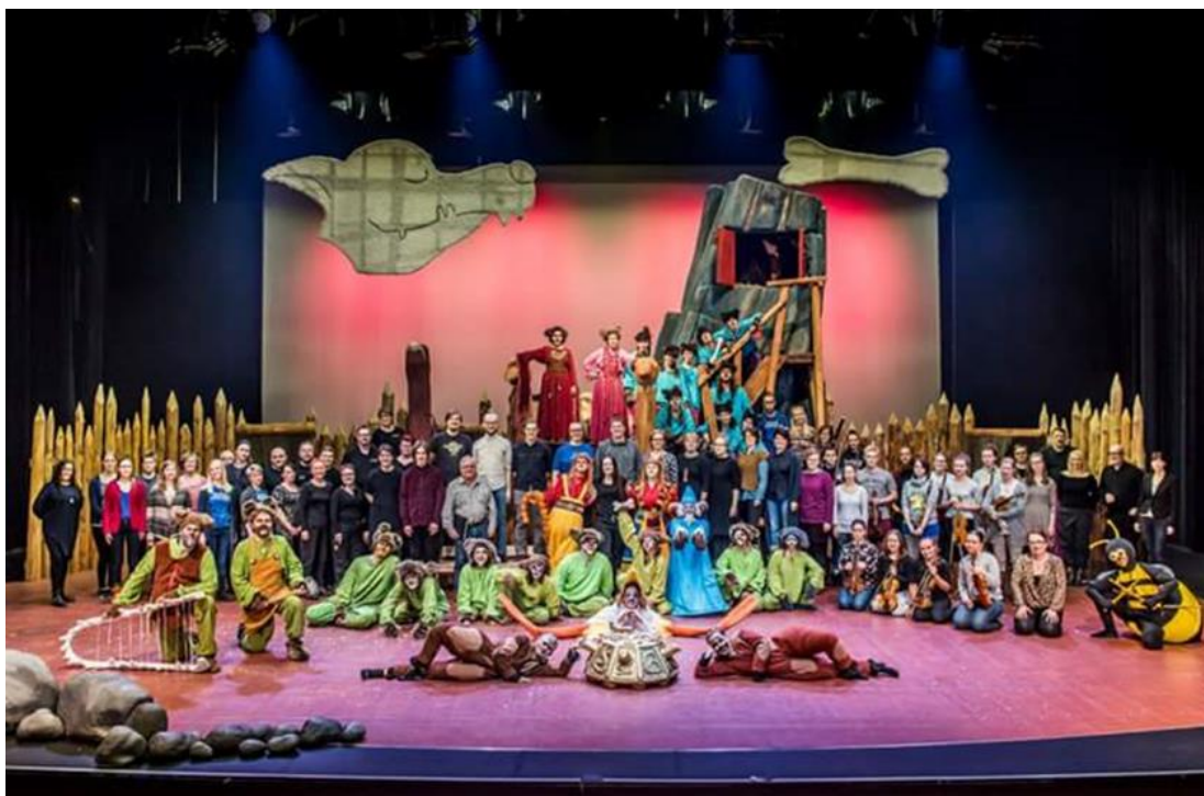
KUVA 1. Koirien Kalevala -opperan työryhmä.

Jaakko Kuusiston (Kuusisto 2003-2004) Koirien Kalevala -oppera oli minulle ensimmäinen teos, jossa toimin korrepetiittorina ja siksi hyvin erityinen musiikillisella taipaleellani. Kuusiston ilmeikäs sävelkieli tarjosi haasteita niin soittajalle kuin laulajallekin. Kuten säveltäjä itse sanoi teoksen ensi-illassa Kuopiossa, teos on sävelletty Suomen huippuammattilaisille.