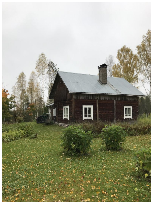
Kuva 1. Oskolan Torppa.

Enjoy Life tarjoaa erilaisten ohjelmapalveluiden lisäksi myös majoituspalveluita. Tällä hetkellä ainoana majoituskohteena toimii Kiihtelysvaarassa noin 50 kilometrin päässä Joensuusta sijaitseva Oskolan Torppa. (Kuva 1.) Noin sata vuotta vanha talonpoikaistorppa on kunnostettu majoituskäyttöön sen historiaa kunnioittaen. Mukaan on kuitenkin tuotu nykyajan mukavuuksia kuten sähköt ja juokseva vesi. Oskolan Torpalla majoittuva voi nauttia suomalaisesta luonnosta ja rauhallisuudesta. Pihapiiristä avautuu loistavat maisemat muun muassa tähtien ja revontulien katseluun. Kesäisin Oskolaan tuodaan lampaita, jotka viihdyttävät majoittujia. (Enjoy Life 2017c.)