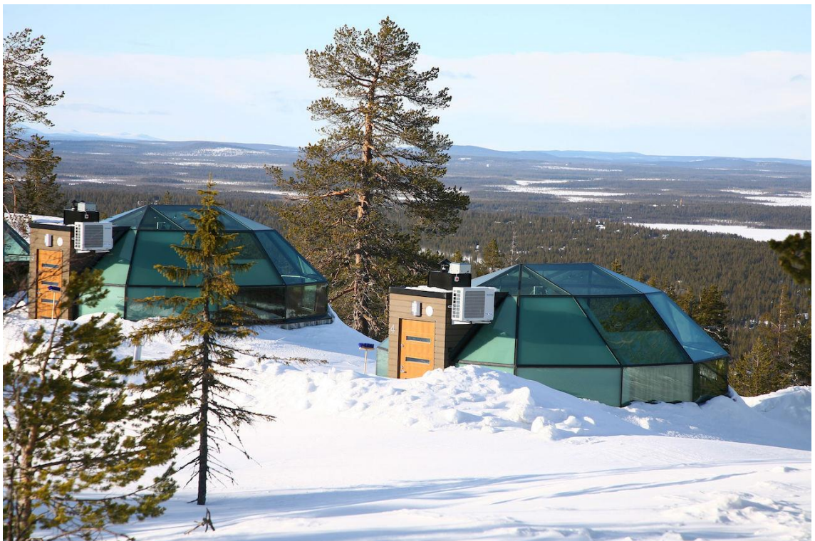
Kuva 2. Levin-iglut

Levin iglut (Kuva 2.) ovat lähes kokonaan lasista valmistettuja iglun mallisia rakennuksia. Iglujen sähkölämmitteiset lasiseinät on valmistettu huurtumattomasta lasista, joka takaa sen, että maisemia voi ihastella säästä riippumatta. Jokaisessa Iglussa on oma wc, suihku ja pieni keittiö. Sen lisäksi huoneet on varusteltu ilmastoinnilla, wifillä ja moottoroiduilla vuoteilla, jotka voi säätää oman mielen mukaan sopivaan asentoon revontulien katselua tai nukkumista varten. (Levin Iglut 2017a.)