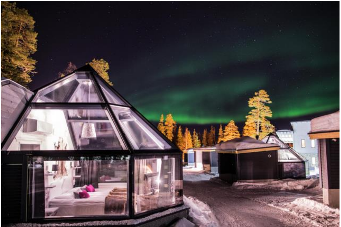
Kuva 4. Santas Hotel Aurora

Santa's Hotel Aurora (Kuva 4.) Luostotunturilla tarjoaa myös lasi-iglu majoitusta. 10 ylellistä lasi-iglua on rakennettu Santa's Hotel Auroran yhteyteen vuonna 2015. Iglut ovat hyvin lähellä toisiaan muodostaen pienen "iglukylän". Iglujen takaseinä on puinen ja muut seinämät lasia. Igluissa tai toisin sanoen lasisissa huoneissa on oma korkealaatuinen wc ja suihku. Muodoltaan nämä huoneet ovat terävähuippuisia poiketen muodoltaan Levin- ja Kakslauttasen igluista.