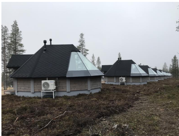
Kuva 4. Northern Light Village Saariselällä. Majoitusrakennuksien muoto samanlainen kuin Aurora Villagessa Ivalossa.

Aurora Village (kuva 4) koostuu 25 majoitusrakennuksesta ja sijaitsee Ivalossa. Majoitusrakennukset ovat muodoltaan kotamaisia ja ne on valmistettu puusta ja lasista. Kotien katosta osa on lasia, joten näkymä avautuu taivaalle. Lasinen osuus alkaa sen verran korkealta, että se myös samalla suojaa yksityisyyttä, vaikka kodat ovatkin melko lähellä toisiaan. (Aurora Village 2017.)