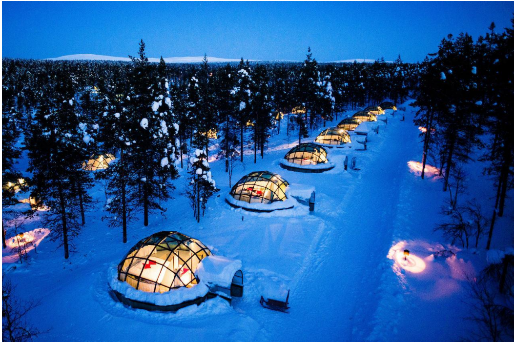
Kuva 3. Kakslauttanen

Kakslauttasella tarjotaan asiakkaille talviaikaan huskysafareita, sillä naapurissa sijaitsee kaksi suurta huskyfarmia. Huskysafarien ohella suosittuja ovat myös porosafarit, joita paikalliset poromiehet järjestävät. Myös moottorikelkka- ja lumikissasafarit kuuluvat palvelutarjontaan. Edellä mainittujen aktiviteettien lisäksi tärkeä vetonaula ovat revontuliretket. Asiakas saa päättää itse haluaako hän lähteä revontuliretkelle erämaahan porolla, hevosella, moottorikelkalla tai esimerkiksi hiihtäen. Myös pilkkiminen, hiihto ja laskettelu kuuluvat talviajan aktiviteetteihin, joita Kakslauttanen tarjoaa. Kesällä matkailijat voivat kokeilla muun muassa kullanhuhdontaa, hevos- ja huskysafareita, patikointia, maastopyöräilyä sekä sienestystä ja marjastusta. Kesällä keskiyön auringon bongaamisesta on tehty oma retkipakettinsa. (Kakslauttanen 2017b.)