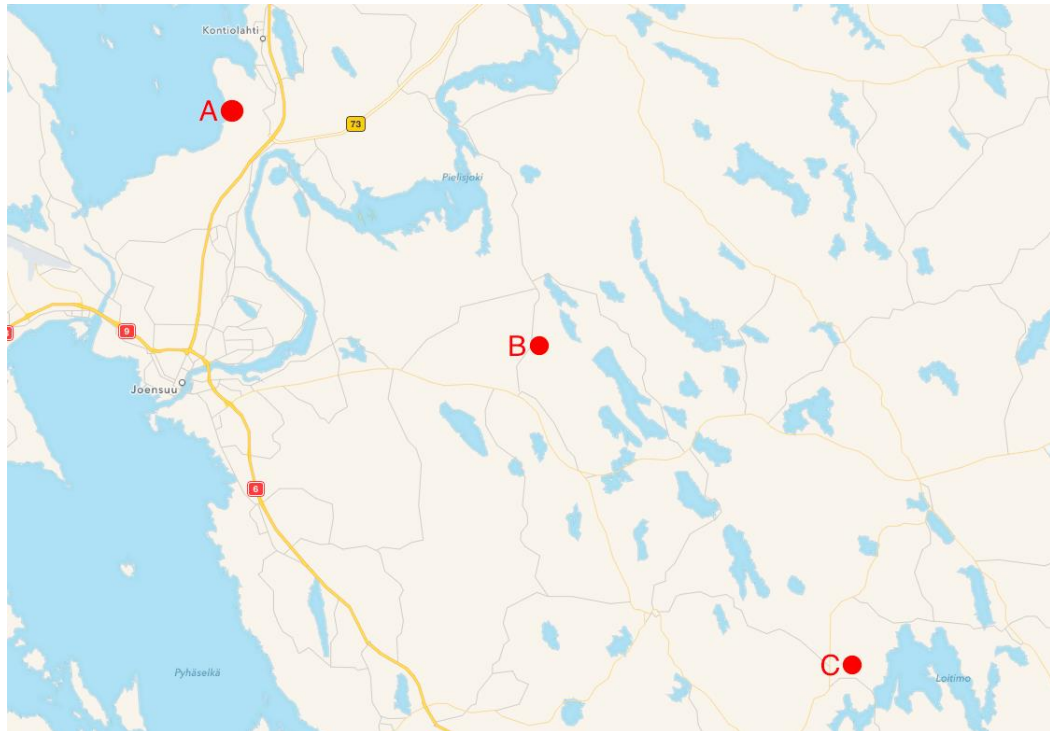
Kuva 5. Kartta majoituspaikkojen vaihtoehdoista.