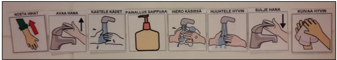
Kuva 5: Esimerkki käsienspesujärjestyskuvista. (Käsienspesujärjestyskuvat: Papunet 2017.)