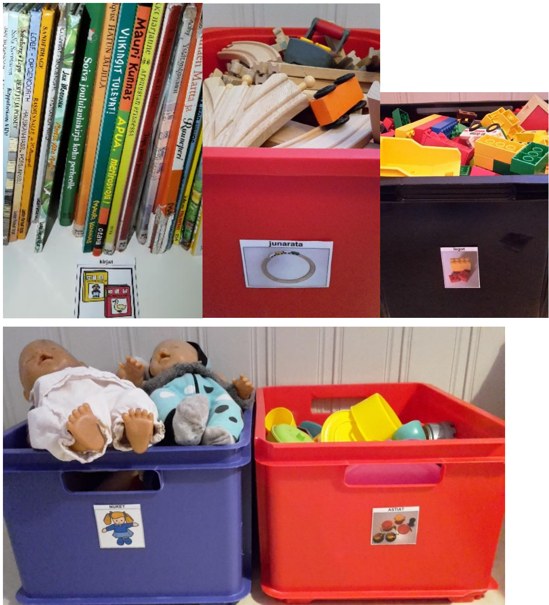
Kuvat 6-9. Esimerkkejä lelulaatikkokuvista. (Lelulaatikkokuvat: Papunet 2017 ja itse tuotetut kuvat.)