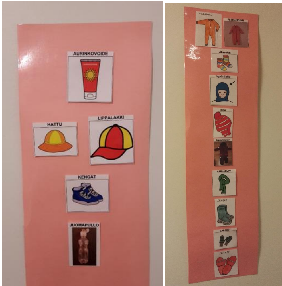
Kuva 3-4. Esimerkkejä pukemisjärjestyskuvista. (Pukemisjärjestys kuvat Papunet 2017 ja itse tuotetut kuvat.)

Aloitin kuvien toteuttamisen kirjaamalla, mitä kuvia tarvitsen. Tämän jälkeen etsin tarvittavat kuvat Papunetin kuvapankista. Kaikkia kuvia en löytänyt kyseisestä kuvapankista, joten piirsin ja valokuvasin osan kuvista itse. Pukemisjärjestyskuvat (kuvat 2 ja 3) laminoin ja toteutin niille kartongista taustan. Kuvat asetettiin eteiseen, siihen tilaan jossa pukeminen kenkiä lukuun ottamatta tapahtui. Käsienpesujärjestyskuvat (kuva 4) kiinnitin kontaktilla käsienpesualtaiden luo sopivalle korkeudelle niin, että lapset pystyvät näkemään ne helposti käsiä pestessä. Lelulaatikkoihin kiinnitin kontaktilla kuvan niistä leluista, mitkä kuhunkin laatikkoon kuuluvat (kuva 5-8).