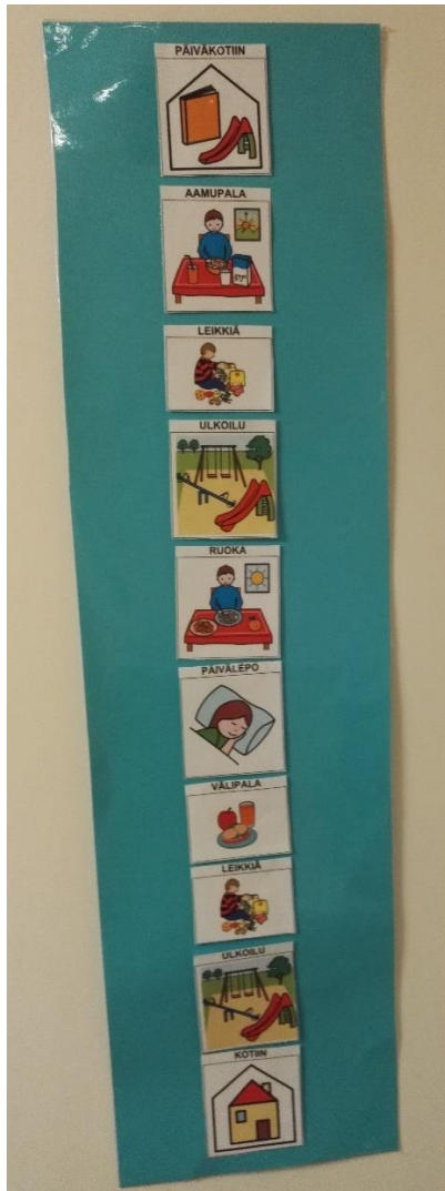
Kuva 2. Esimerkki kuvitetusta päiväjärjestyksestä. (Päiväjärjestyskuvat: Papunet 2017.)

Kuvien käytön lisääminen oli jäänyt kuitenkin toteuttamatta. Kasvattajat kokivat, että aikaa oli rajallisesti eikä kuvien lisäämistä vain ole saatu aikaiseksi. Kuvien lisääminen vaativat tietoisin panostamisen ja ajanottamisen juuri siihen asiaan, joten se on jäänyt. He kokivat, että opinnäytetyön kautta tuli kuvien lisäämiseen tarvittava aika, sillä oli joku, joka paneutui juuri siihen.