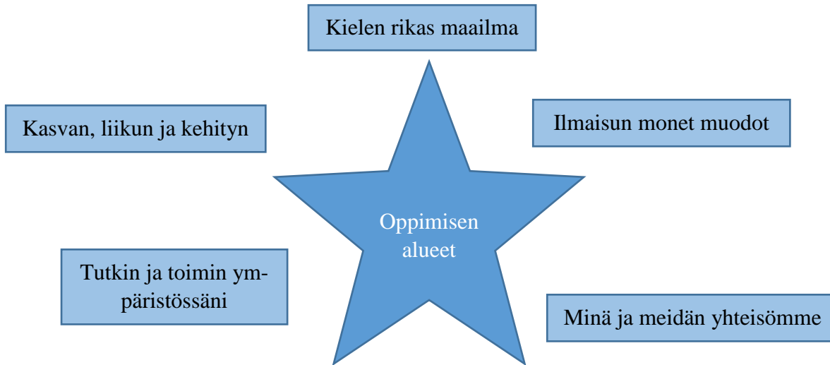
KUVIO 2. Varhaiskasvatussuunnitelman (2016) mukaiset oppimisen alueet

Päiväjärjestyksellä on merkitystä sekä lapselle että aikuiselle. Sen avulla luodaan suotuisat olosuhteet myönteisille emootioille. Päiväjärjestyksen perusteellisen suunnittelun laiminlyönnin on todettu vaikuttavan haitallisesti lapsen fyysiseen ja psyykkiseen kehitykseen. Kasvattajan käyttäessä joka päivä samaa toimintojen peräkkäisyyttä, lapsi oppii hiljalleen ennakoimaan positiivisesti päivän kulkua. Esimerkiksi lapsi tottuu siihen, että vanhempi hakee hänet hoidosta päivän jälkimmäisellä ulkoilukerralla. (Helenius & Korhonen 2008, 82-83.)