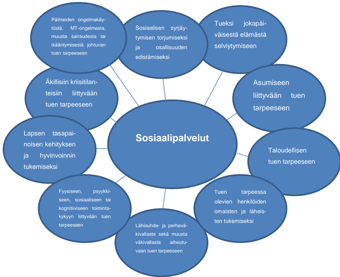
Kuva 1 Sosiaalipalvelut (STM 2015d)