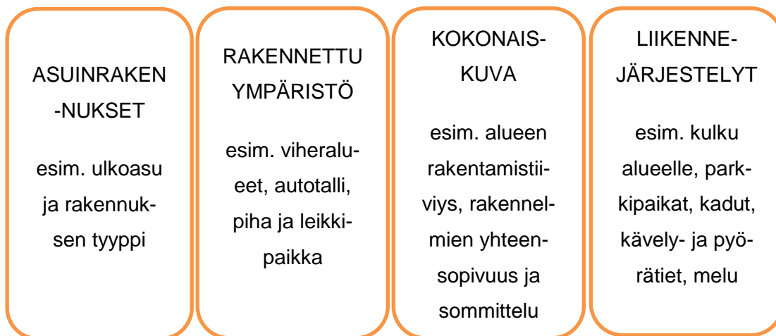
KUVIO 1. Haastatteluissa käytetyt teemat

kanssa ennalta valitsemansa asuinympäristökohteet. Haastateltaville ei etukäteen oltu kerrottu kohteiden sijaintia, jotta heille ei olisi annettu mahdollisuutta ennakkokäsityksiin. Jokaisessa kohteessa haastateltavaa pyydettiin mainitsemaan hänen mielestään kyseisen asuinympäristön hyviä ja huonoja ominaisuuksia rakennettuun ympäristöön liittyvistä teemoista (kuvio 1):