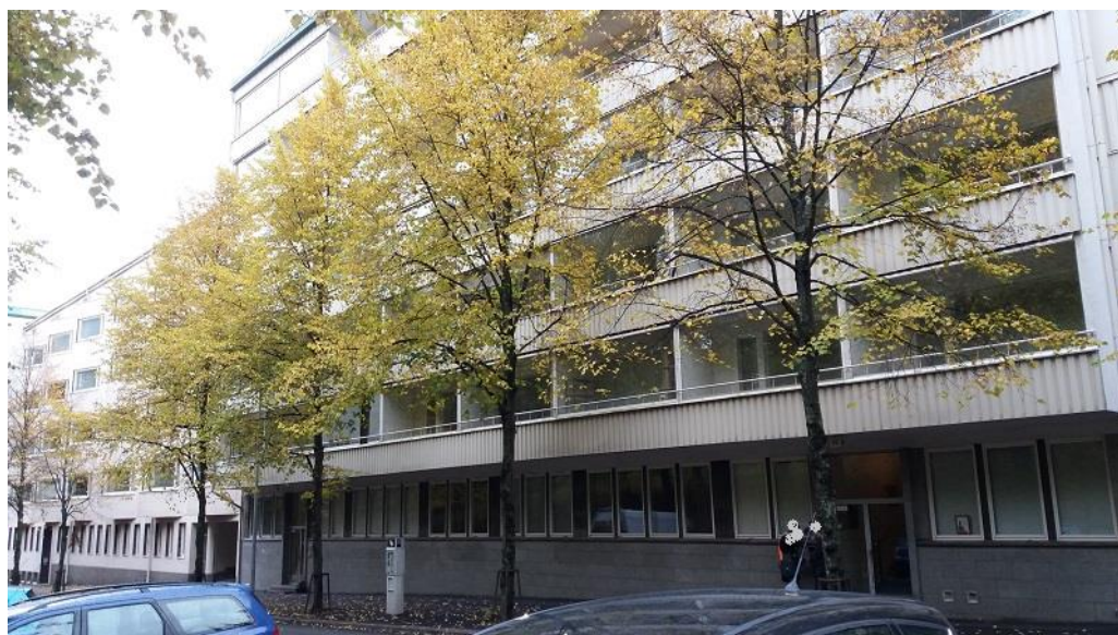
KUVA 6a. Kohde 3 Päijänteenkatu

Kohde 3 oli Päijänteenkadun Lahdenkadun puoleinen pää. Tämä kohde oli ympäristöltään muita vehreämpi. Kohde sijaitsi Kirkkopuiston kupeessa ja siinä oli 1954 ja 1961 rakennetut kerrostalot (kuva 6a). Näiden vieressä oli Mallasjuoman vuonna 1912 rakennettu tehdasrakennus, mistä kaavaillaan myös Lahden uuden taidemuseon sijoituspaikkaa (kuva 6b).