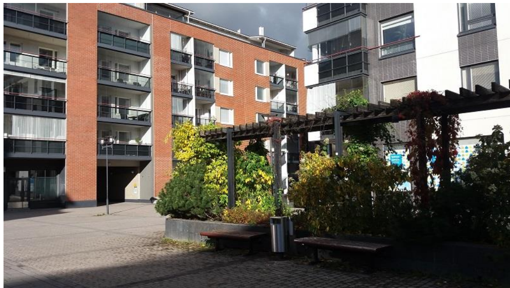
KUVA 5b. Kohde Mallaskadun ja Panimokadun risteys

Kohde 3 oli Päijänteenkadun Lahdenkadun puoleinen pää. Tämä kohde oli ympäristöltään muita vehreämpi. Kohde sijaitsi Kirkkopuiston kupeessa ja siinä oli 1954 ja 1961 rakennetut kerrostalot (kuva 6a). Näiden vieressä oli Mallasjuoman vuonna 1912 rakennettu tehdasrakennus, mistä kaavaillaan myös Lahden uuden taidemuseon sijoituspaikkaa (kuva 6b).