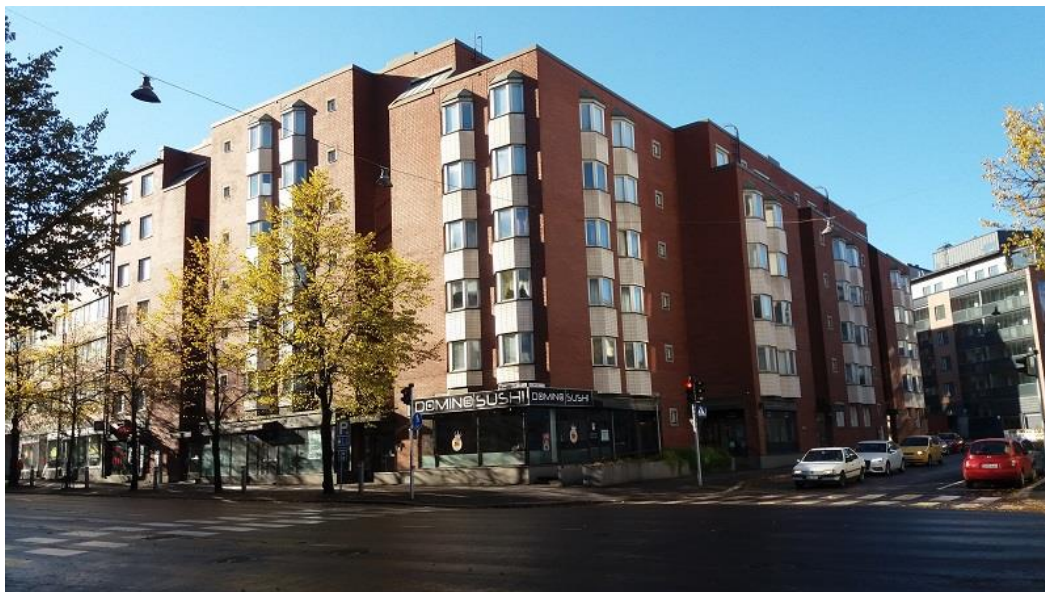
KUVA 4b. Kohde 1 Vesijärvenkadun ja Kulmakadun risteys

Kohde 2 oli Mallaskadun ja Panimokadun risteys. Tässä kohteessa rakennuskanta oli uudempaa (2010-luvulla rakennettuja kerrostaloja, kuvat 5a ja b) ja massaltaan suurempaa kuin kahdessa muussa kohteessa. Rakennusten keskiössä oli aukio, johon oli sijoitettu viheralue sekä muutama penkki. Alueella oli myös vanha panimorakennus (kuva 5a), joka purettiin ennen viimeistä haastattelua.