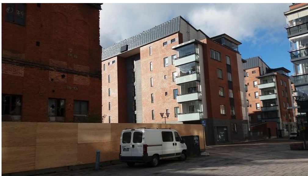
KUVA 5a. Kohde 2, Mallaskadun ja Panimokadun risteys, vasemmalla vanha purettu panimorakennus

Kohde 2 oli Mallaskadun ja Panimokadun risteys. Tässä kohteessa rakennuskanta oli uudempaa (2010-luvulla rakennettuja kerrostaloja, kuvat 5a ja b) ja massaltaan suurempaa kuin kahdessa muussa kohteessa. Rakennusten keskiössä oli aukio, johon oli sijoitettu viheralue sekä muutama penkki. Alueella oli myös vanha panimorakennus (kuva 5a), joka purettiin ennen viimeistä haastattelua.