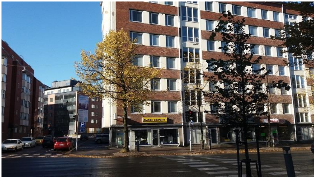
KUVA 4a. Kohde 1, Vesijärvenkadun ja Kulmakadun risteys

Kohde 1 oli Vesijärvenkadun ja Kulmakadun risteys. Tässä kohteessa oli vuonna 1984 ja 1959 rakennetut kerrostalot vierekkäin, ja niiden takana näkyi vuonna rakennettu 2017 uusi kerrostalo, kuvat 4a ja b. Rakennusten edessä kulki pitkä ja suora katu, jota reunusti lehmusrivistö. Katu on toinen Lahden keskustan läpi etelä-pohjoissuuntaisesti kulkevista pääkaduista. Liikenteeltään tämä paikka oli vilkkaampi kuin kaksi muuta kohdetta.