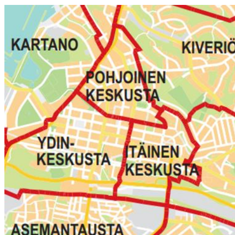
KUVA 1. Lahden keskustalla tässä tutkimuksessa tarkoitetaan aluetta johon kuuluvat kuvassa näkyvät: Pohjoinen keskusta, Ydinkeskusta ja Itäinen keskusta (Lahden kaupunki 2017d)