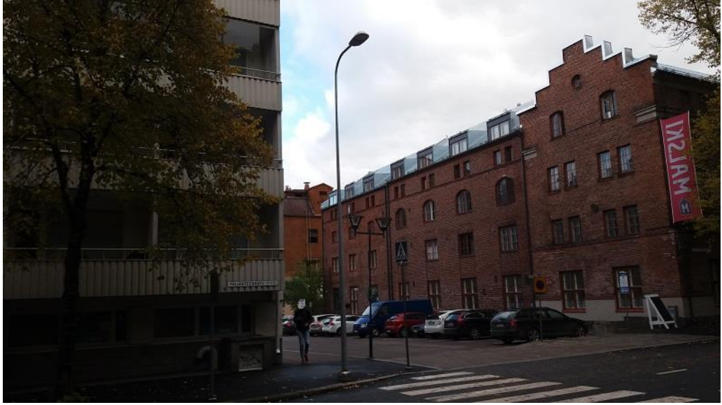
KUVA 6b. Kohde 3, Pääjärvenkatu