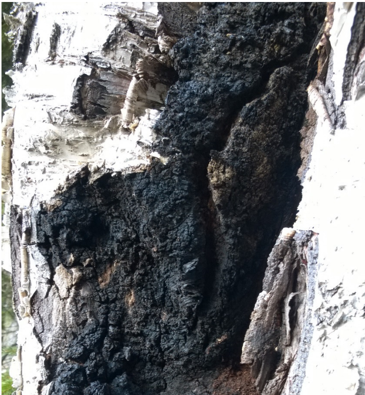
Kuva 2. Pakuria koivun kyljessä.

Keväällä 2017 hankkeeseen haettiin pilottitiloja ja hakemuksia tuli lyhyessä ajassa kaikkiaan 30. Hankkeeseen valittiin 6 pilottitilaa, joille Lapin AMKin opiskelijat tekivät yhteistyössä Itä-Suomen yliopiston kanssa luonnontuotepainotteiset metsäsuunnitelmat. Suunnitelmat sisältävät saman tietosisällön kuin perinteinen metsäsuunnitelma, mutta sen lisäksi suunnitelmassa on inventoitu tiloilla esiintyvien luonnontuotteiden määriä, arvioitu tilan luonnontuotteiden tuotantomahdollisuuksia. Metsänomistajilla oli eniten kiinnostusta ja tiloilla mahdollisuuksia tuottaa pakuria, kuusen ja männyn pihkaa, kuusenkerkkiä sekä koivunlehtiä.