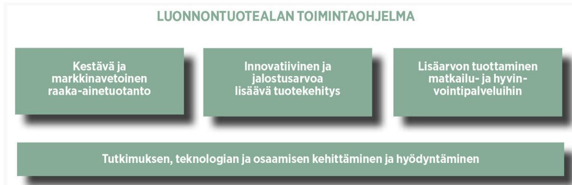
Kuvio 2. Luonnontuotealan toimintaohjelman 2020 painoalat. Rutanen 2014.

Luonnontuotealan toimijoiden keskeisiä keskusteluaiheita ovat vuoden 2017 aikana olleet mm. vahvan luonnontuotebrändin rakentaminen, luomukeruualueiden laajentamistarpeet sekä yritysten alati kasvava raaka-ainekysyntä (Ristioja 2017). Vuonna 2014 tuotetun Luonnontuotealan toimintaohjelman 2020 mukaan menestyvän luonnontuotealan elinkeinon perusedellytys on toimiva raaka-ainetuotanto. (Rutanen 2014.)