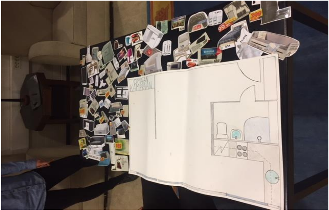
Kuva 4. Omaan Kämppään- pelin lähtökohdat Taloushallinta-ryhmän tapahtumassa.

Pelissä nuori selvisi selvästi alle 1500 euron budjetin. Hänellä oli hyvin realistinen kuva siitä, että mitä ensiasuntoon tulisi hankkia. Hän koki, että esimerkiksi erilaiset sisustustavarat kuten matot, eivät ole välttämättömiä hänelle. Niin asuntoon kuin asumiseen liittyvät kulut olivat nuorella hyvin tiedossa.