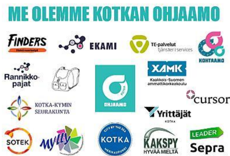
Kuva 1. Me olemme Kotkan Ohjaamo

sen asteen koulutuksen tai varusmiespalvelun. Tavoitteena on tehdä Ohjaamosta matalan kynnyksen yhden oven palvelukokonaisuus, jonne nuoret voivat tulla, oli heidän asiansa mikä tahansa. Ohjaamossa on aina paikalla aikuinen, joka on valmiina keskusteluun ja käymään läpi nuoren kanssa asioita luottamuksellisesti. Kotkan Ohjaamo haluaa lisätä nuorten osallisuutta ja vaikuttamismahdollisuuksia. Nuorten hyvinvointia vahvistetaan monialaisella yhteistyöllä ja yhteisellä tekemisellä sekä yhteisöllistä työtötta käyttämällä ja myönteisellä ihmiskäsityksellä. (Ohjaamo 2016.)