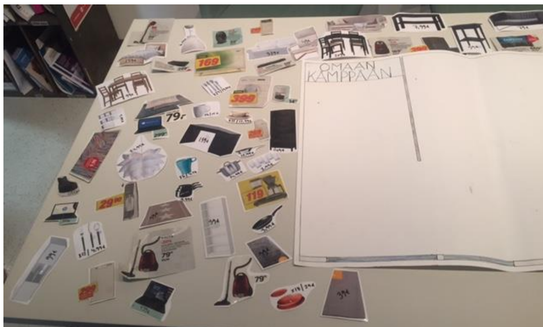
Kuva 3. Omaan Kämpään- pelin sisustuselementtejä.