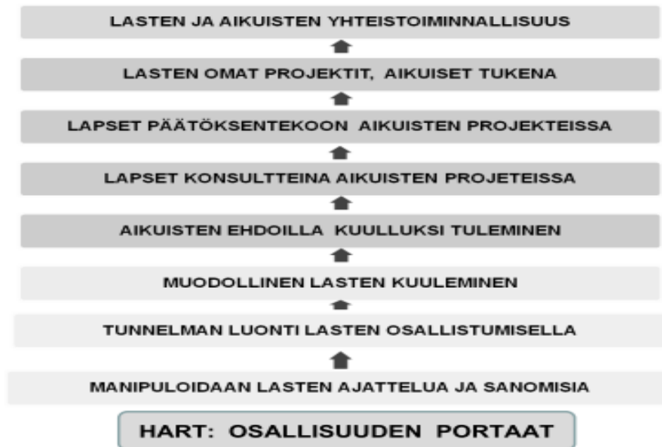
Kuvio 1. Lasten osallisuuden portaatt Hartin mukaan (Turja 2011b, 27)