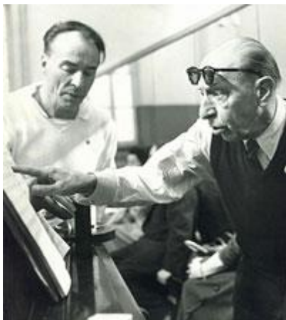
Kuva 2. George Balanchine ja Igor Stravinsky