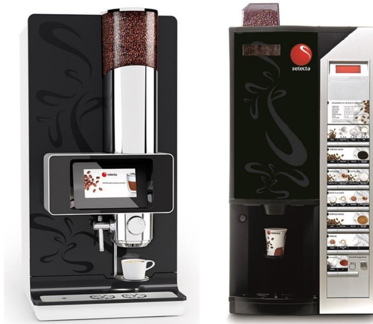
Kuva 1. Ferrara (oikea) ja Amalfi kahviautomaatit. (Selecta, tuotteet).

Opinnäytetyön aikana keskityttiin tutkimaan Ferrara ja Amalfi nimisiä kahviautomaattimalleja, joissa olivat asiakkaiden ilmaiskäytössä. Käytännössä automaattimallit poikkeavat ulkonäön lisäksi sisäisten reseptiensä puolesta. Jokaiseen eri kahviautomaattimalliin on syötetty säiliökoot sekä reseptit, joiden mukaan lasketaan, paljonko tuotteita kuluu jokaisessa eri tilauksessa.