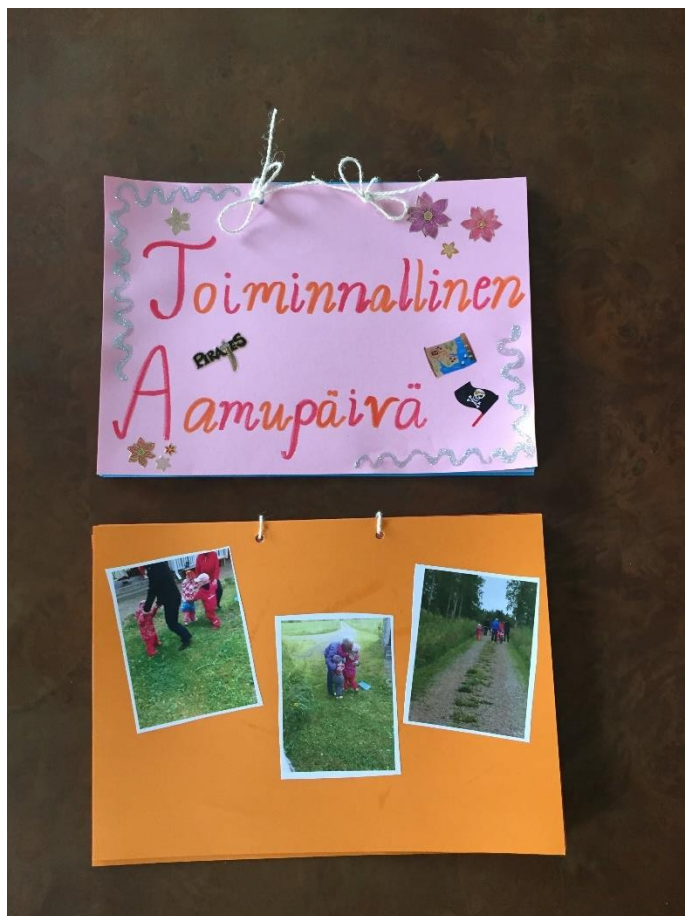
KUVA 3. Toiminnallisen aamupäivän dokumentointi (Saastamoinen 2017).