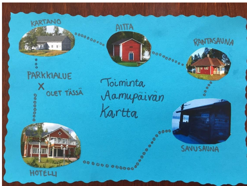
KUVA 2. Toiminnallisen aamupäivän kartta (Saastamoinen 2017).