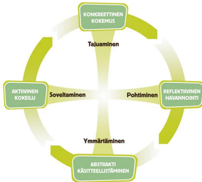
Kuvio 3. Kokemuksellisen oppimisen sykli (Kolb 2015; Opintokeskus Sivis 2016).

painottuvat oppimisen ja tiedon soveltamisen prosessi enemmän kuin sisältö tai oppimisen tulokset. Lisäksi tieto nähdään muutosprosessina, joka jatkuvasti uudistuu ja luodaan uudelleen ja siihen vaikuttavat niin ulkopuoliset kuin omakohtaiset tekijät. Uusi tieto ikään kuin rakentuu jo olemassa olevan kokemuksellisen tiedon päälle. Kuviossa 3 esitetään Kolbin kokemuksellisen oppimisen sykli (Kolb 2015: 31-32, 49-52.)