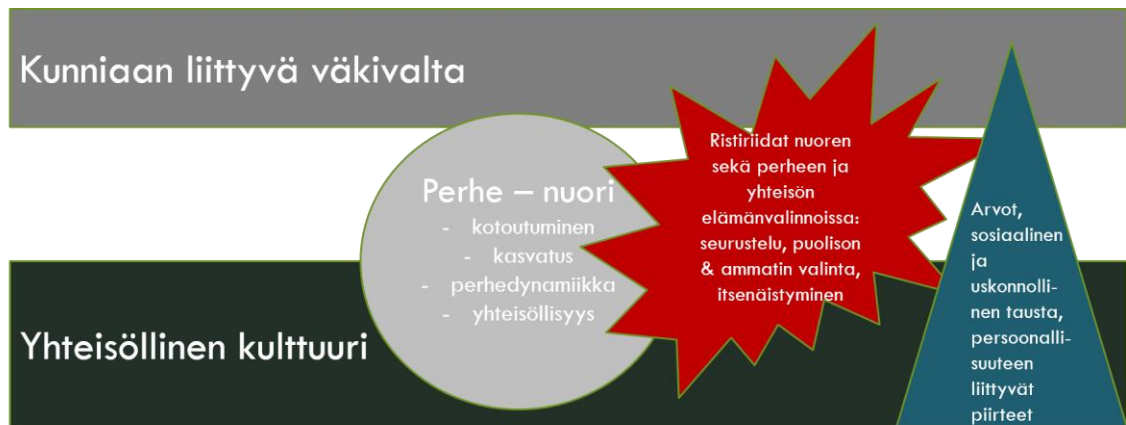
Kuvio 6. Kunniaan liittyvän väkivallan ilmeneminen ja taustatekijät