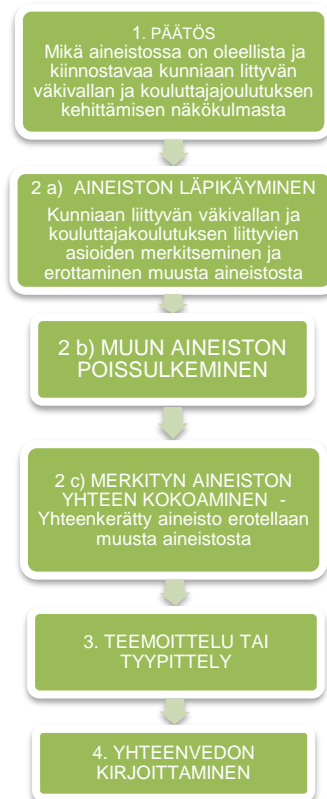
Kuvio 5. Aineiston analysoinnin eteneminen (Tuomi & Sarajärvi 2009: 92).

Ennen ryhmähaastattelulla keräämäni aineiston auki kirjoittamista kuuntelin nauhat vielä kertaalleen läpi ja tein itselleni muistiinpanoja miellelyhtymistä ja jo siinä vaiheessa mieleeni tulevista teemoista. Litteroitua aineistoa kertyi 39 A4 arkkaa fonttikoolla 12 ja rivivälillä 1. Haastattelun auki kirjoittamisvaiheessa jätin aineiston käsittelyn helpottamiseksi ulkopuolelle joitakin täytesanoja, kuten niinku- ja tota- ilmauksia ja muita tutkimuskysymysten kannalta merkityksettömiä ilmaisuja.