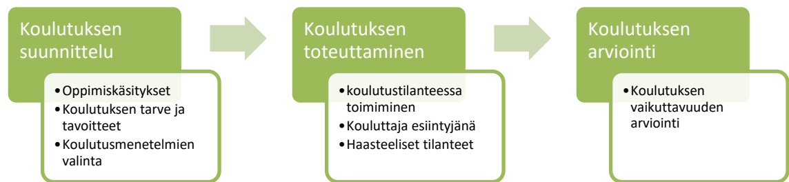
Kuvio 2. Kouluttajakoulutuksen kehittämisen eteneminen (Kupias & Koski 2012, 55).