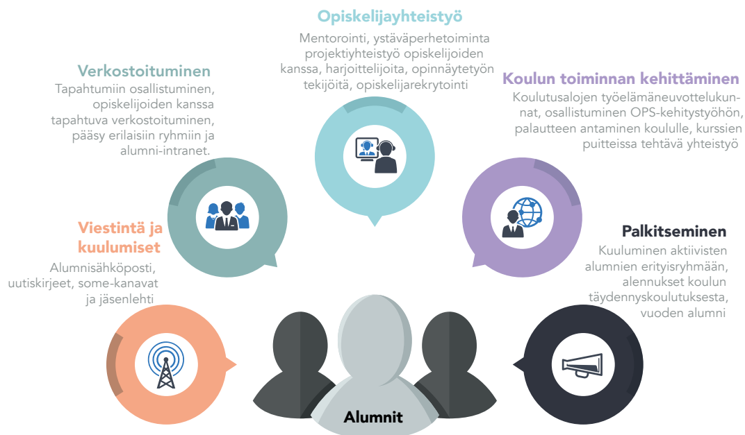
Kuvio 2. Alumnitoiminnan lisäarvot

Alumnitoiminnan lisäarvoja voi hahmottaa esimerkiksi alla olevan jaottelun mukaan (kuvio 2).