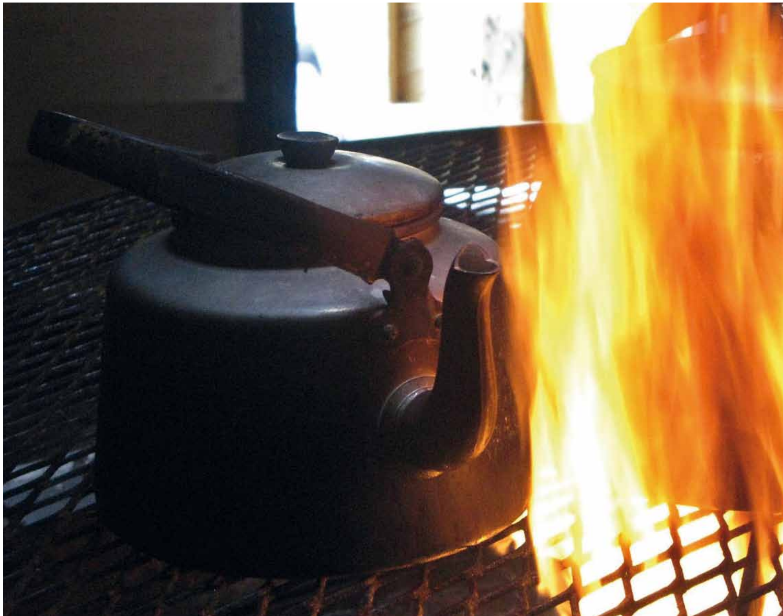
Jaoimme tunnelmia tulen äärellä.

myös he ymmärtävät tarinan voiman. Tulevan jaetun asian-tuntijuuden ymmärryksen ja oivaltamisen kannalta tämä oli ydintehtävä. Tärkeää oli, että kaikki saivat kertoa oman tarinansa sellaisena kuin itse halusivat. Olimme jakaneet valmentavat pienryhmiin niin, että mukana oli yksi valmentaja. Jokainen kertoi tarinansa, ja sen jälkeen oli vielä aikaa jutella pienryhmän kanssa. ”Muiden tarinoiden kuunteleminen oli avartavaa ja antoi perspektiiviä tämänhetkiseen elämäntilanteeseeni. Tunnelmaksi jäi nöyryys elämän edessä; haluamme ja koetamme ohjata elämää, mutta todellisuudessa emme voi vaikuttaa kaikkeen.”