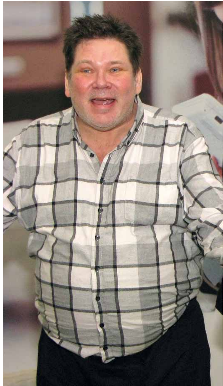
Tarinateatteri Hyvän Kätilön esitys herätti ajatuksia.

Valmennuksessa olevat kokemusasiantuntijat työskentelevät pääosin kuntaorganisaatioissa, joten mm. Sipoon SOTETalosta oli paikalla kokemusasiantuntija ja henkilökuntaa kertomassa matkastaan kohti asiakkaita osallistavia palveluja ja työskentelyä kokemusasiantuntijoiden kanssa. Sipoossa on kehitetty kokemusasiantuntijoille monipuolisia tehtäviä, kuten kokemusasiantuntijan vastaanottoja ja erilaisia ryhmätoimintoja jne. Sipoon mallissa on erityisen energinen ja innostava työskentelytapa. Sipoon on hieno esimerkki ketterästä kehittämisestä ja siitä, että tahdolla kaikki on mahdollista. ”Sipoon vieraat toivat hienon lisän päivään. Ihanan innostuneita ihmisiä. Oli todella kiva kuulla, miten Sipoossa on lähdetty kokeilemaan kokemusasiantuntijuutta. Heidän mallissaan olisi monelle kunnalle paljon annettavaa.”