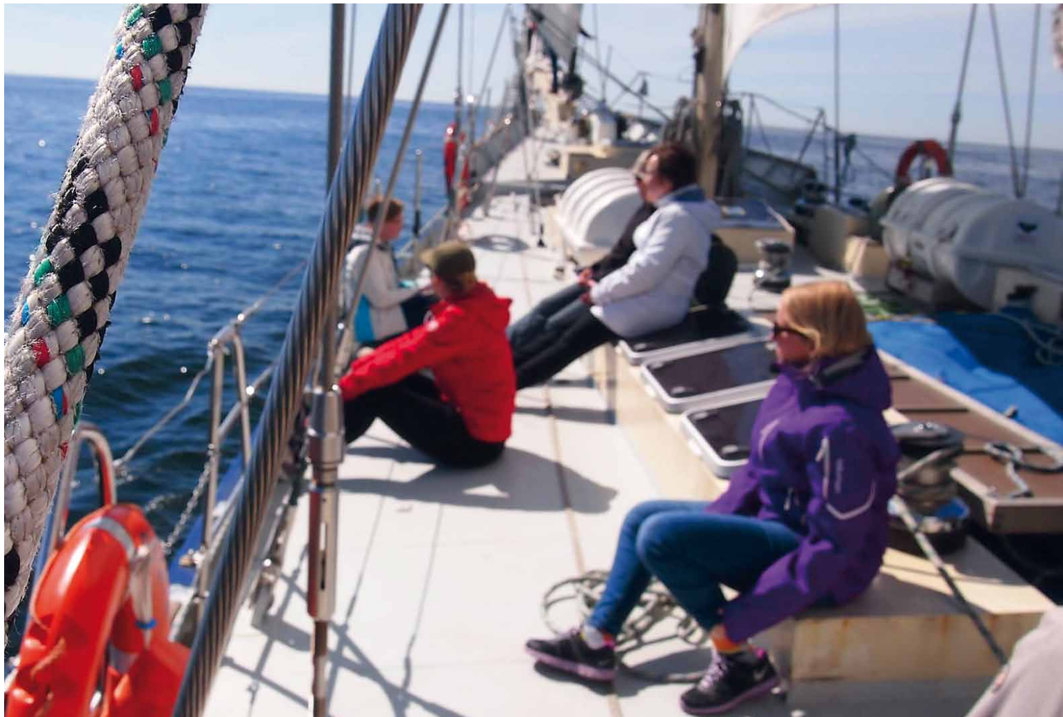
Samassa veneessä -valmennus huipentui purjehdukseen Kuunari Helenalla.