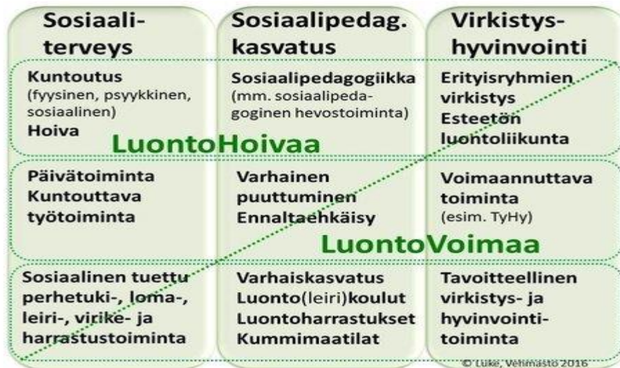
KUVIO 2. Luontolähtöisten toimintamuotojen jakautuminen eri toimialoille.

LuontoHoiva tarkoittaa luontolähtöisiä sosiaali- ja terveystalvueluita ja LuontoVoima muita luontolähtöisiä virkistys- ja hyvinvoinnin sekä kasvatuksen palveluita (Green Care Finland 2016). Olemme oppineet opinnäytetyön sekä sosionomiopintojen kautta, kuinka voimme tulevaisuudessa hyödyntää etenkin LuontoVoiman -menetelmiä omassa työssämme. Erilaisia menetelmiä voimme hyödyntää niin asiakkaiden, työyhteisöjen kuin myös oman hyvinvoinnin lisäämiseksi.