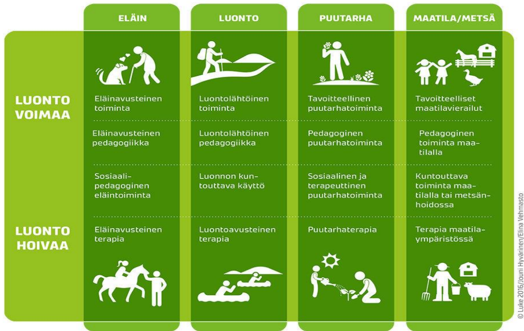
KUVIO 3. Green Care -menetelmien jakautuminen Luontovoiman ja Luontohoivan alueille.

Eläinavusteisista menetelmistä koulutuksen käyneiden ammattilaisten toteuttama ratsastusterapia on Suomessa tunnetuin eläinavusteisen terapian muoto. Sosiaalipedagogisessa hevostoiminnassa painopisteenä on ennaltaehkäisevä toiminta sekä sosiaalisen kuntoutuksen tarpeet, joista koulutuksen käynyt ohjaaja vastaa. Eläinavusteisessa toiminnassa sekä -terapiassa voidaan hevosten ohella käyttää monia muitakin koti- tai lemmikkieläimiä, kuten koiria ja kissoja. Kiinnostus on kasvanut myös lehmien, laamaeläinten, lampaiden, vuohien ja kanojen kanssa toteutettavaan eläinavusteiseen työskentelyyn. (Green Care Finland i.a.e.)