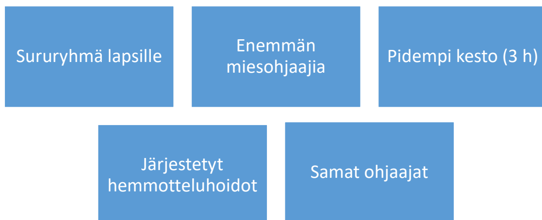
KUVA 2. Vanhempien yleisimmät kehitysehdotukset LapsiArkki-toiminnalle

Vanhempien toiveissa ja kehitysehdotuksissa korostui ohjaajien merkitys. Heille oli kaikille tärkeää, että ohjaajat, niin seurakunnan omat kuin vapaaehtoisetkin, vaikuttavat nauttivansa työstään ja osoittavat sen niin lapsille kuin vanhemmille. Ohjaajien pysyvyys ja vapaaehtoisten sitoutuminen tuli esille useamman kerran. Varsinkin pienille lapsille on tärkeää, että heillä on sama hoitaja, eivätkä kasvot ole erit jokaisella hoitokerralla. Koska haastateltavat olivat tässä otoksessa kaikki äitejä, ja perheissä ei ole isää, ainakaan arjessa läsnä, niin isähahmon merkitys korostui. Neljä äitiä toivoi miesohjaajia, jotka voisivat huomioida varsinkin poikailasten toiveet pelaamiseen ja välillä vähän rajumpaankin painimiseen sekä liikunnallisiin aktiviteetteihin. Esitettiin myös toiveita jakaa toimintaa pienille ja isomille lapsille erikseen.