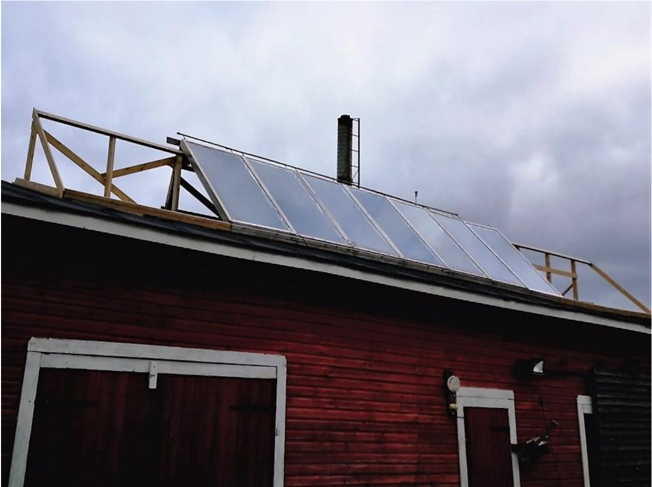
KUVA 2. Kalle Hoppulan tilalle asennetut aurinkolämpökeräimet. Keräinten tuottama lämpö otetaan talteen lämpökeskuksen yhteydessä olevaan varajaan

Maatiloilla energiankulutus vaihtelee huomattavasti tuotantosuunnittain. Tuotantosuunnittain suurimmat energiankulutukset ovat puutarha- ja siipikarjataloudessa. Esimerkiksi maitotiloilla energian kokonaiskulutuksen keskiarvo on 135 MWh ja siipikarjataloudessa 587 MWh/tila. Suurin osa energiankulutuksesta maataloudessa kohdistuu työkoneisiin ja tuotantotilojen valaistukseen ja lämmitykseen sekä asuinrakennuksen lämmön- ja sähkönkulutukseen. Keskimäärin 33 % energiankulutuksesta käytetään työkoneiden polttoaineisiin ja 29 % tuotantotiloihin. Käytetystä energiasta kuluu keskimäärin 19 % sekä viljankuivaukseen että asuinrakennuksiin. [6] [7]