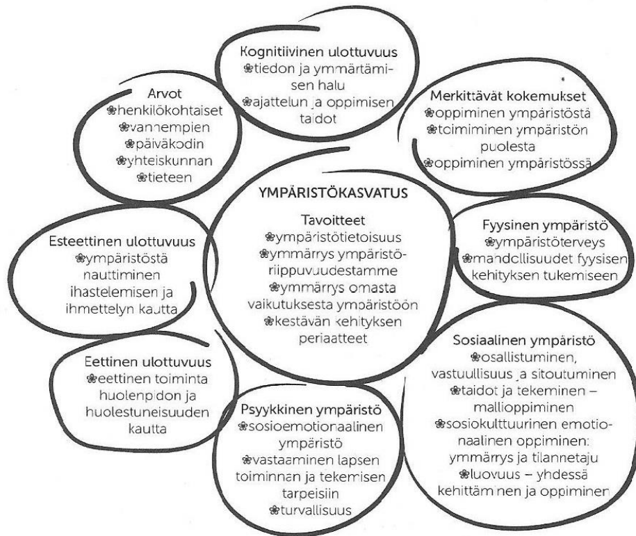
Kuvio 14. Ympäristökasvatuksen tavoitteet ja oppimiseen vaikuttavat tekijät

monin eri tavoin. Ympäristökasvatuksella onkin suuri rooli pedagogiikassa ja meidän kasvattajien tulisi muistaa sen tärkeys arjessamme.