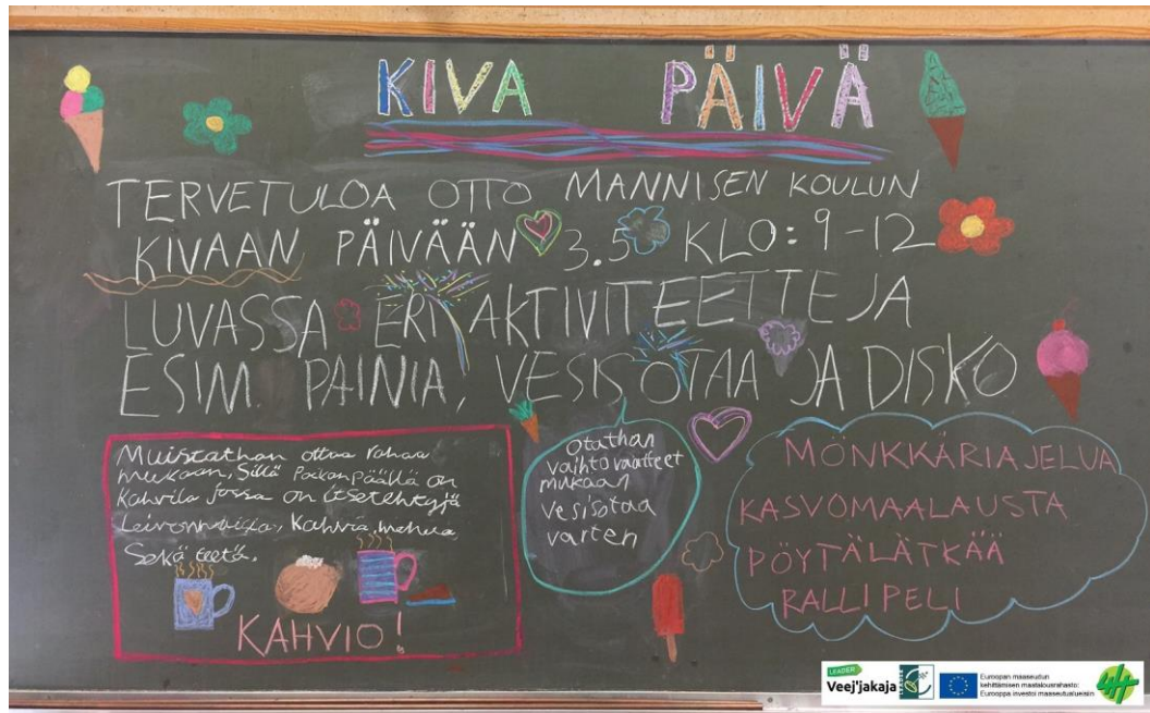
Kuva 2. Oppilaiden tekemä ”juliste” tapahtumasta Kiva päivä (Pieksämäen seudun 4H-yhdistys Ry 2017)

Tapahtumassa oli mukana seitsemän vapaaehtoista kyläyhdistyksestä ja metsästysseurasta. Oppilaita tapahtumaan osallistui 40, muita osallistujia oli 30. Oppilaat kantoivat vastuunsa heille jaetuista pisteistä. Painiryhmän vastuhenkilöt olivat jopa valmistaneet palkinnot teknisentyön tunneilla. Tapahtuma oli varsin onnistunut ja kyläläiset ottivat sen hyvin vastaan. Jos tapahtuman ajankohta olisi ollut myöhemmin päivällä, osallistujia olisi voinut olla enemmän. Oppilaat olivat koko päivän hyvin yrittelijäitä ja heistä näki, että olivat nauttineet tapahtuman suunnittelusta sekä itse tapahtumasta. (Lauttaanaho 2017.)