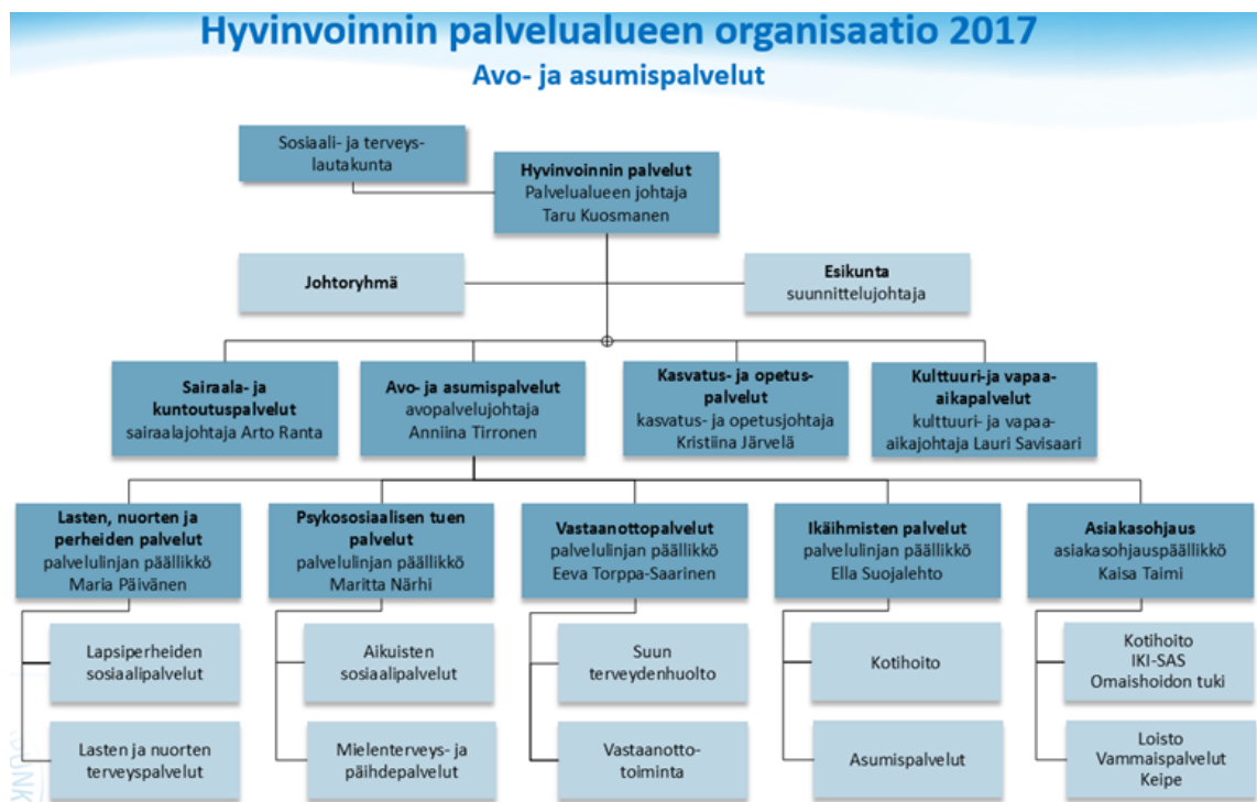
KUVA 1. Hyvinvoinnin palvelualueen organisaatio 2017 (Avo- ja asumispalvelut 2017a)

Avo- ja asumispalvelut hoitavat sosiaalityön ja terveydenhuollon palveluita Tampereella. Palveluryhmä edistää, tukee ja hoitaa niin terveyttä, psyykkistä hyvinvointia, sosiaalista turvallisuutta kuin valmiuksia sujuvaan arkeen. (Tampereen kaupunki 2017.) Palvelut tuotetaan kokonaistaloudellisesti ja liikkeelle lähdetään aina asiakkaiden tarpeista. Tarkoituksena on edistää asiakkaiden kokemaa elämänlaatua eri elämäntilanteissa. (Avopalvelut 2016.) Käytännössä avo- ja asumispalveluiden järjestettäväksi kuuluvat kaikki sosiaalipalvelut aina neuvolasta kouluterveydenhuoltoon ja terveystasemista psykiatriisiin poliklinikkoihin.