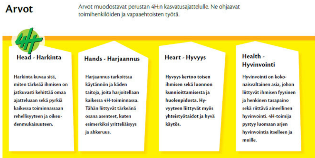
KUVA 2. 4H-toiminnan arvot

Kuvasta 2 nähdään 4H-yhdistyksen arvot, joihin kuuluvat harkinta, harjaannus, hyvyys ja hyvinvointi (4H-yhdistys: Arvot). Arvot osoittavat 4H-yhdistyksen tukevan nuoria yrittäjämäiseen ajattelutapaan, johon kuuluu esimerkiksi jatkuva oman ajattelun kehittäminen. Arvoista ilmenee myös asenteen merkitys, sillä järjestö kannustaa esimerkiksi yhteistyöhön muiden kanssa ja oman sekä toisten hyvinvoinnin lisäämiseen.