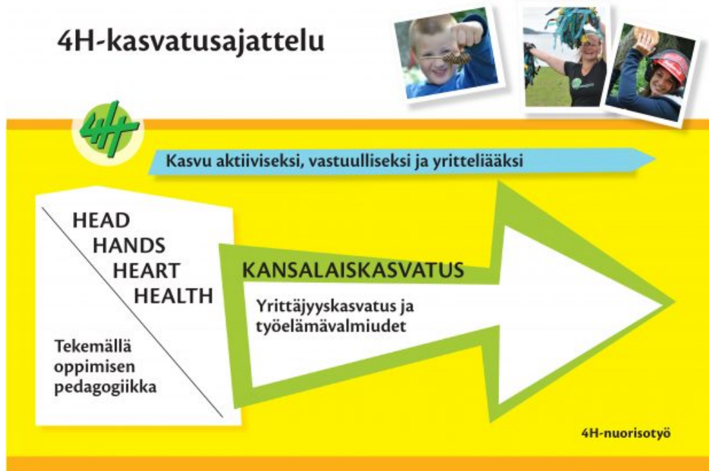
KUVA 1. 4H-toiminnan kasvatusajattelu

vatusajattelussa tavoitteena on kasvu aktiiviseksi, vastuulliseksi ja yritteliääksi (4H-yhdistys: Tule nuorelle yritysohjaajaksi). Tämän opinnäytetyön toimintaympäristönä oleva ”Tuunaa sun kesäduuni” –kurssi on suurin yrittäjyyskasvatuksen muoto 4H-yhdistyksen toiminnassa. Sen lisäksi yrittäjyyskasvatuksen piirteitä on myös 4H-yhdistyksen järjestämissä kerhoissa ja yhteistyötoiminnassa kouluille.