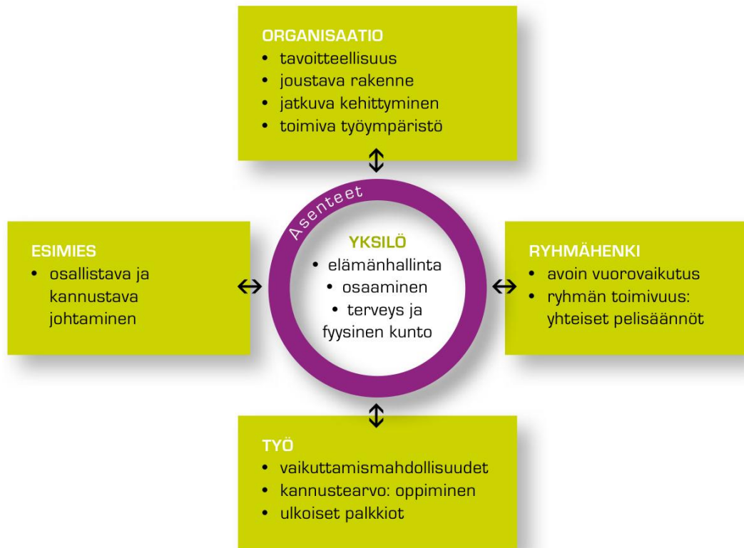
Kuvio 2. Työhyvinvoinnin tekijät (Manka ym. 2010: 8.)

kannalta merkityksellisimmät tekijät. Yksilön työhyvinvointi syntyy suhteesta työhön, ryhmähenkeen, esimieheen ja organisaatioon. Työhyvinvoinnin kokonaisuus syntyy näiden viiden (5) tekijän sisällöistä ja vuorovaikutuksesta. Liuhamon mallista poiketen tästä mallista puuttuu työympäristön näkökulma. (Manka ym. 2010: 7–9.)