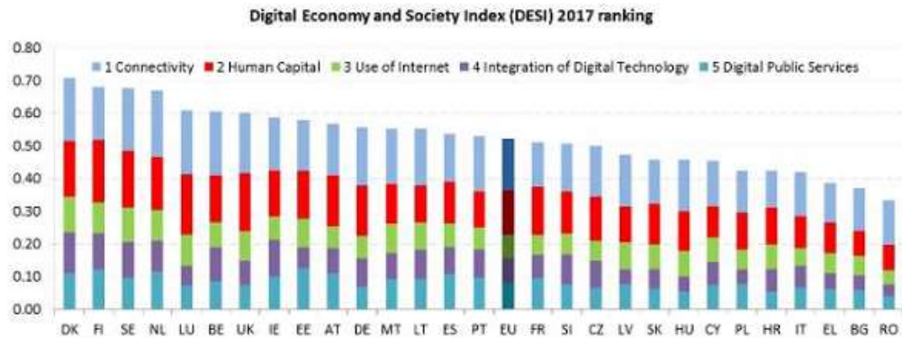
KUVIO 2. DESI 2017 -indeksit maittain (European Commission 2017)

DESI 2017 -indeksi koostuu viidestä eri osa-alueesta (European Commission 2017):