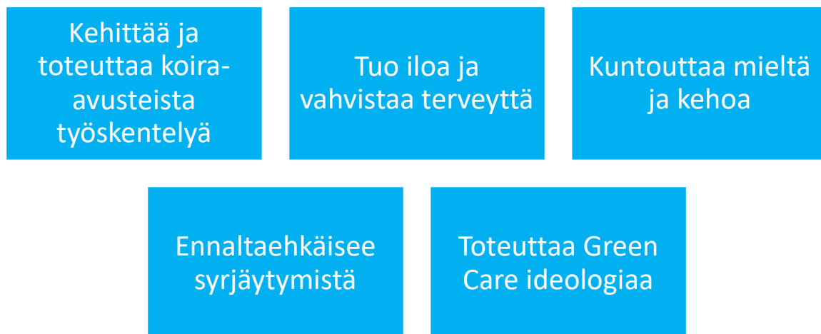
Kuvio 1. Hali-Koiran moninainen osaaminen ja vaikuttaminen koira-avusteisessa työskentelyssä. (Hali-Koira 2018.)

Hali-Koiran toiminta on laadukasta ja se toteuttaa Green Care ideologiaa. Ideologia perustuu luontoon ja maaseutuympäristöön liittyvään ammatilliseen toimintaan. Tarkoituksena on edistää ihmisen hyvinvointia ja elämänlaatua. Hyvinvointia lisäävät vaikutukset syntyvät muun muassa kokemuksellisuuden, luonnon elvyttävyyden ja osallisuuden avulla. Green Care toiminta sijoittuu usein esimerkiksi luonnonympäristöön, mutta luonnon elementtejä voidaan käyttää myös kaupunki- ja laitosympäristöissä. (Green Care Finland 2018.) Hali-Koiran työskentely on moninaista ja moniammatillista (Kuvio 1).