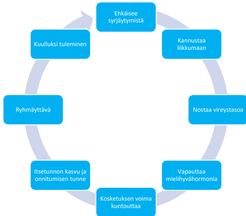
Kuvio 3. Koira-avusteisen työskentelyn kuntouttavat tekijät. Kuvio perustuu menetelmistä saatuihin tuloksiin.

vaan kuvioon on kiteytetty muutamia esimerkkejä siitä, miksi voidaan tulla siihen tulokseen, että Hali-Koiran toteuttama koira-avusteinen työskentely on kuntouttavaa (Kuvio 3).