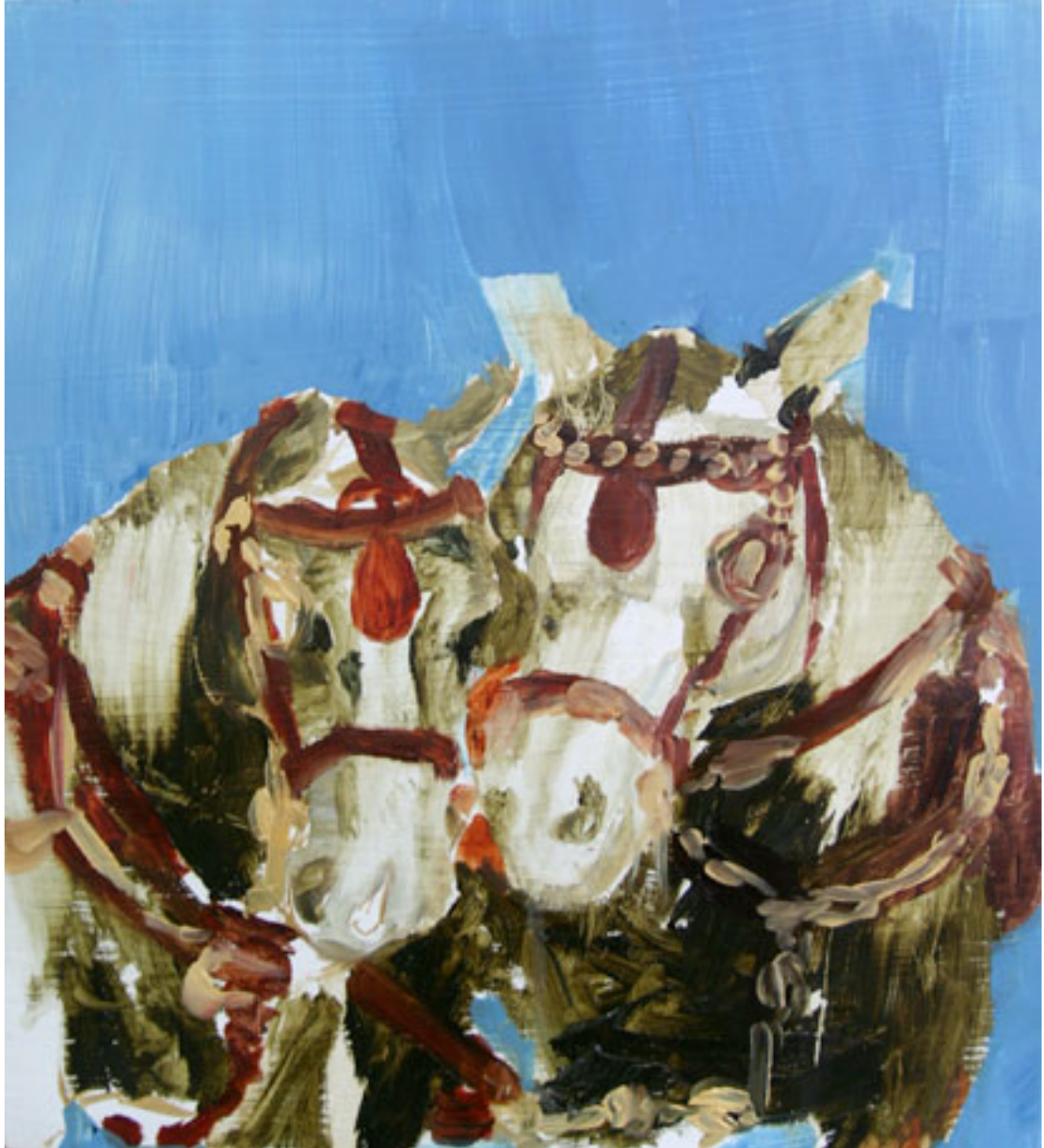
Maalaus sarjasta Viisi tähteä: Timantteja ja verukkeita Vesiohenteinen öljyvärei MDF-levylle 26,3cm x 29,1cm 2009