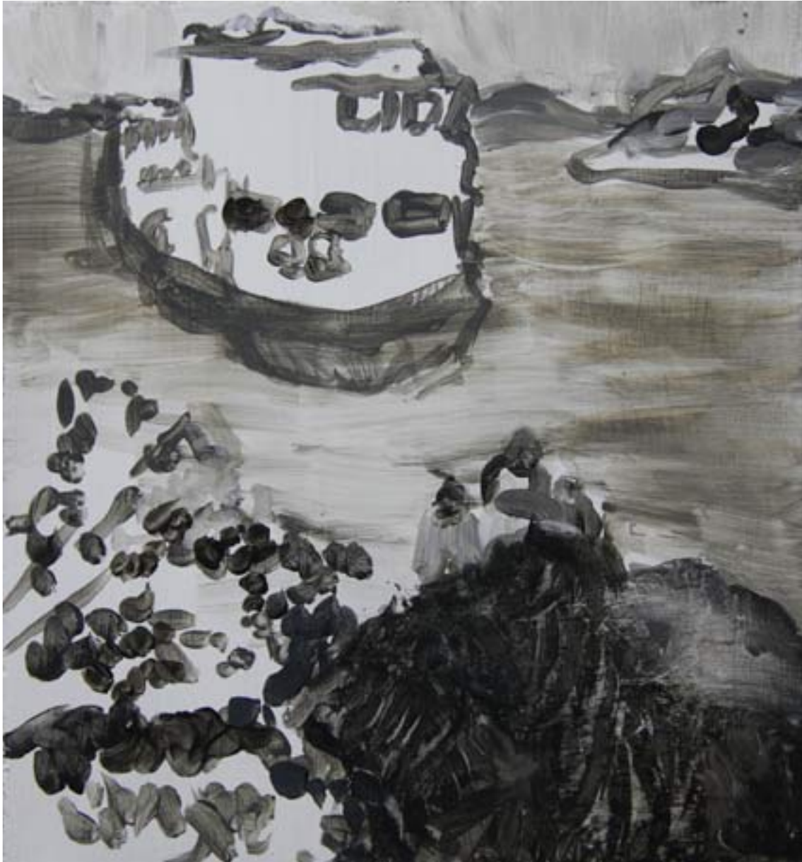
Maalaus sarjasta Viisi tähteä: Mielenkiintoisia tarjouksia Akryyli MDF-levylle 26,3cm x 28,4cm 2009