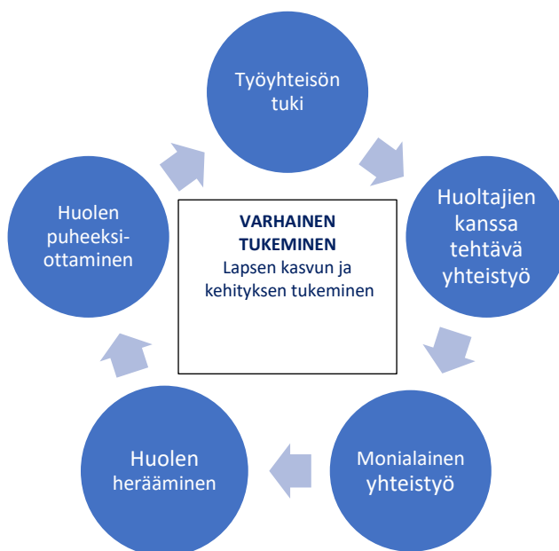
Kuva 2. Aineistosta nousseet teemat

Kuten yllä olevasta aineistosta nousseista teemoista käy ilmi, on varhaisen tukemisen keskiössä aina lapsen kasvun ja kehityksen tukeminen. Jotta varhaista tukemista voidaan toteuttaa laadukkaasti, tukevat ympärillä olevat teemat sitä. Näitä lapsen kasvua ja kehitystä tukevia osa-alueita ovat tässä tutkimuksessa nostettu huolen herääminen, huolen puheeksi ottaminen, työyhteisön tuki, huoltajien kanssa tehtävä yhteistyö sekä monialainen yhteistyö.