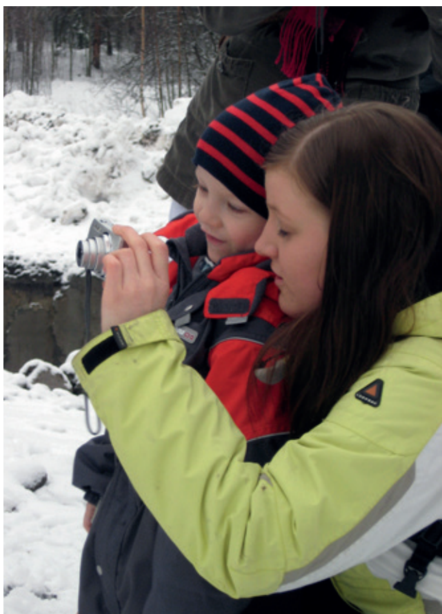
"NÄIN KAMERA TOIMII"

olivat kuvat työmaakoneista, vesielementit ja lumi sekä toiset lapset. Lapset viihtyivät ja uppoutuivat uuden asuinalueen kuvaamiseen. Lasten ottamia kuvia kertyi kaiken kaikkiaan 250. Opiskelijoiden ottamia kuvia kertyi noin 300.