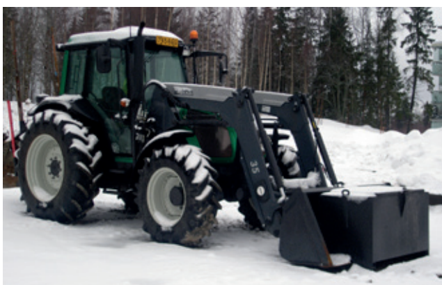
"TRAKTORILLA TEHDÄÄN TÖITÄ"