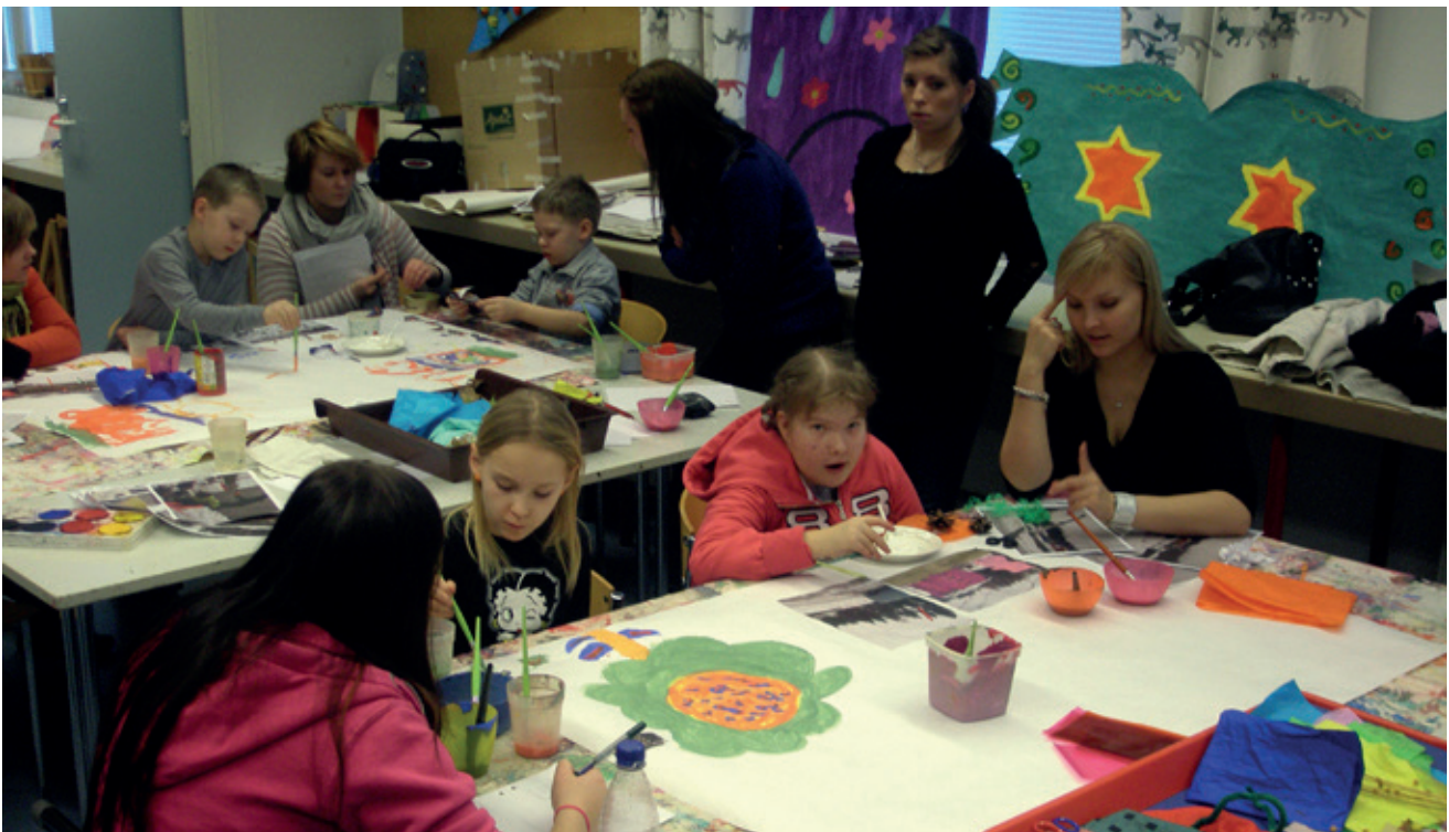
"TÄÄ ON KUKKAPUU. SE ON ERIKOINEN. SINISET ON SIITEPÖLYÄ. SIT NE PUNASET ON SELLASTA SIITEPÖLYSSÄ OLEVAA HUNAJAA, JOTKA ON LAITTANU SIIHEN MEHILÄISET."

sitä mukaa kun he tulivat ja toiminta aloitettiin saman tien. Pienryhmien kokoonpano oli sama kuin retkipäivänä ja pääpaino oli nyt lasten saduttamisessa ja askartelun avustamisessa. Lisäksi dokumentoinnin vastuupiskelijat tallensivat työpajan