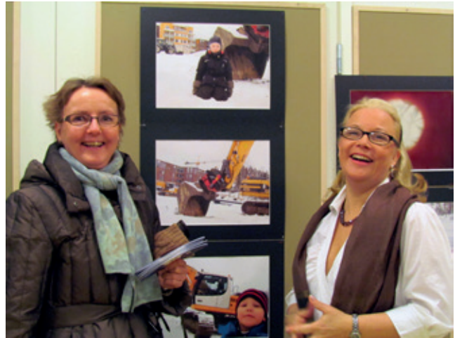
VALOKUVANÄYTTELY "SUURPELTO LAPSEN SILMIN" 8.3.2011 PITKIÄ PELLAVIA! -TAPAHTUMASSA

Valokuvausprojektin purku- ja arviointitilaisuus pidettiin 16.2.2011 opiskelijoiden ja opettajien kesken. Valokuvausprojekti käytiin läpi osissa ja opiskelijat saivat ilmaista mielipiteensä ja kehittämisehdotuksensa projektista. Opiskelijat toivat esille mielipiteensä, kehittämistoiveensa ja onnistumisen kokemuksensa yhteisestä uudentyypisestä työskentelystä. Lisäksi opiskelijoilta kerättiin kirjallinen itsearviointi, joka oli tehty KOULII-hankkeen opetus- ja tapahtumakokeiluja varten. Opettajat jatkoivat valokuvien työstämistä valitsemalla valokuvanäyttelyyn tulevat valokuvat, painattamalla ne mainostuimistossa, kehystämällä kuvat sekä pystyttämällä näyttelyyn. Yhteisen työskentelyn lopputulos huipentui 8.3.2011 pidettyyn valokuvanäyttelyyn "Suurpelto lapsen silmin". Näyttely pidettiin Maakirjan päiväkodissa "Pitkiä Pellavia!"-tapahtuman yhteydessä. Näyttelyssä kävi noin 250 vierasta kahden tunnin