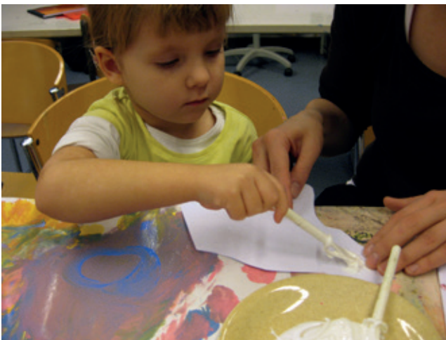
TAIDEPAJATYÖSKENTELYÄ RETKEN JÄLKEEN.

toiminnan valokuvien. Lapset työskentelivät erittäin keskittyneesti ja lopputuotoksena oli isoja ja värikkäitä valokuvakollaa-seja. Saduttaminen tapahtui rauhallisesti toisessa huoneessa.