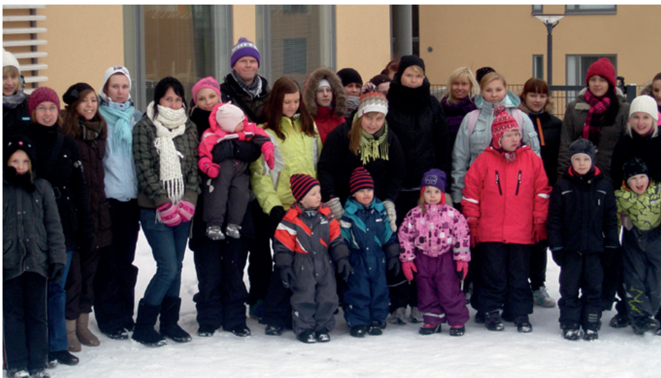
KAIKKI PAIKALLA, VALOKUVAUSRETKI VOI ALKAA

Valokuvausprojektin retkipäivä toteutui Suurpellon alueella 5.2.2011. Mukana olivat 25 opiskelijaa, 7 lasta ja 1 opettaja. Lapset olivat 2–11 -vuotiaita, opiskelijoille tuttuja, mutta keskenään toisilleen vieraita lapsia. Lasten annettiin tutustua toisiinsa rauhassa leikkien päiväkodin piha-alueella ennen varsinaista retkeä. Tutustumisleikkien jälkeen opiskelijat jakaantuivat sovituihin pienryhmiin, siirtyivät päiväkodin pihalta asuinalueelle lasten kanssa ja varsinainen valokuvaaminen alkoi. Pienryhmät koostuivat nyt 4 opiskelijasta ja 1 lapsesta. Opiskelijoista 2 ohjeisti lasta valokuvaukseen ja keskittyi lasten ajatusten kuuntelemiseen ja kirjaamiseen ja 2 opiskelijaa dokumentoi eli otti valokuvia heidän toiminnastaan. Lapset johdattelivat pienryhmää eteenpäin ja toiminta eteni lapsen ehdoilla. Lapset eivät liikuneet laajalle alueelle, vaan löysivät kiinnostuksen kohteensa lähimaastosta. Pienryhmät hajaantuivat pikku hiljaa toisistaan. Osa lähti luontoon, osa kiinnostui rakennustyömaasta ja osa halusi pysytellä päiväkodin lähellä. Lapset tutustuivat kaivinkoneisiin ja muihin rakennustyömaakoneisiin sekä lumikasoihin ja kokeilivat mäenlaskua. Työmaakuopat, montut, lätäköt sekä vesileikit kiinnostivat lapsia. Myös lasten pihatelineet olivat