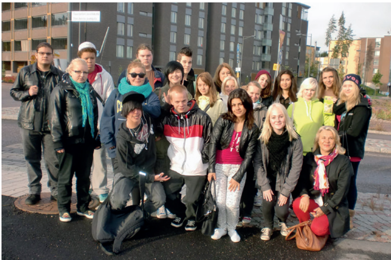
NUORET SUURPELLOSSA SYYSKUU 2012

päätösseminaarissa 21.11.2012 ja siitä on tehty abstrakti Kuopion Kansainvälisen konferenssin COEHREN posterinäyttelyyn 17.-19.4.2013.