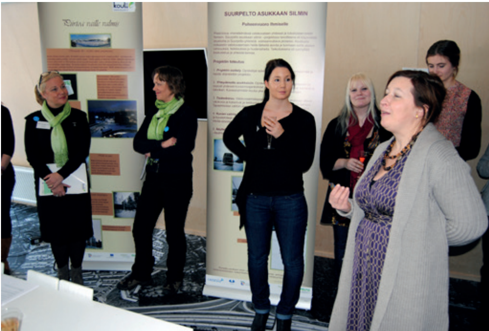
"PUHEENVUORO IHMISELLE – SUURPELTO ASUKKAAN SILMIN" -NÄYTTELYN AVAJAISET OLIVAT 8.3.2012 PITKIÄ PELLAVIA! -TAPAHTUMASSA SUURPELLON INFOPÄVILJONGISSA.

valokuvata, missä he tapaisivat ja katselisivat otoksiaan, kerättiin kamerankäytön lisävinkkejä ja painotettiin valokuvien julkaisuluvan allekirjoittamista. Tässä tapaamisessa suunniteltiin myös ryhmätapaamisten järjestelyistä (näihin pyrittiäisiin), sovittiin väritulostamisesta, annettiin ohjeita tiedonkeruuseen, tallentamiseen ja tarinoiden dokumentoimiseen. Opiskelijat vastuutettiin pitämään yhteyttä "omaan" asukkaaseensa ja pitämään hänet ajan tasalla projektin etenemisestä.