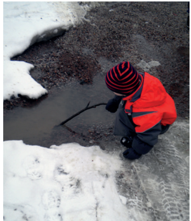
"KU TÄSSÄ RAPAKOSSA OLI NIITÄ KEPPEJÄ JA JOS SINNE MENIS, NII SIT UPPOAIS, EIKÄ SINNE KANNATA MENNÄ."

Seuraavalla viikolla 10.2.2011 iltapäivällä opiskelijat pitivät taidepajan retkellä olleille lapsille. Pajan tarkoituksena oli käydä retkipäivän tunteja ja ajatuksia läpi sekä työstää valokuvakollaaseja ja saduttaa lapsia. Lapset otettiin vastaan yksilöllisesti