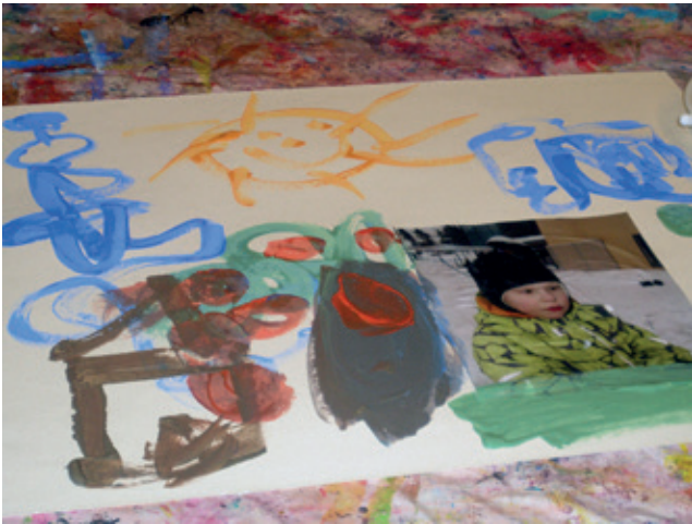
"KESÄLLÄ SIELLÄ PAISTAA AURINKO. KESÄLLÄ VOISI PELATA JALKAPALLOA."