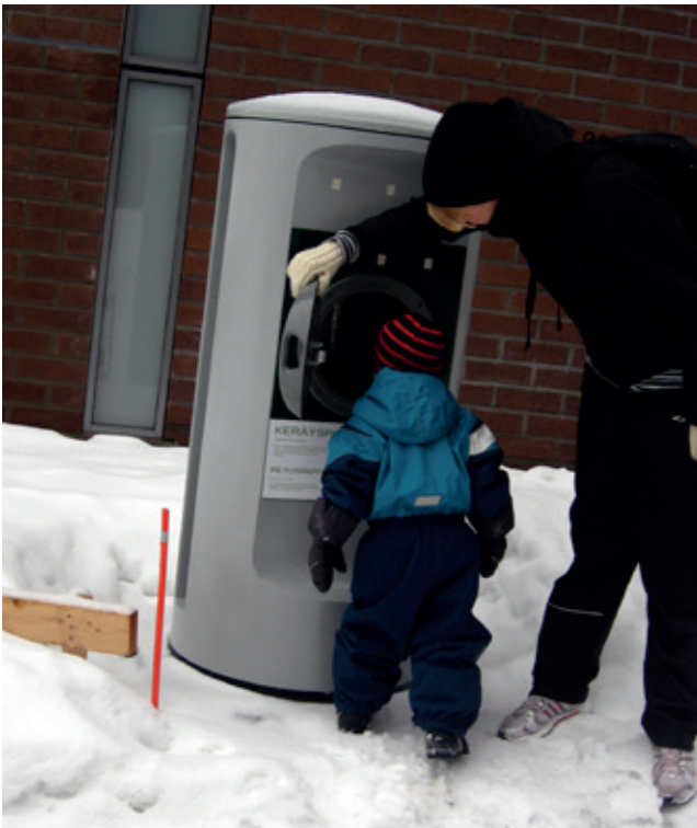
"NE ROSKIKSET OLI SEMMOSIA, ETTÄ NIISTÄ MENI PUTKI MAAN ALLE. MEIÄN ROSKIS ON SELLANEN PIKKUNEN TALO. OLI SE JOTENKI ERILAINEN."