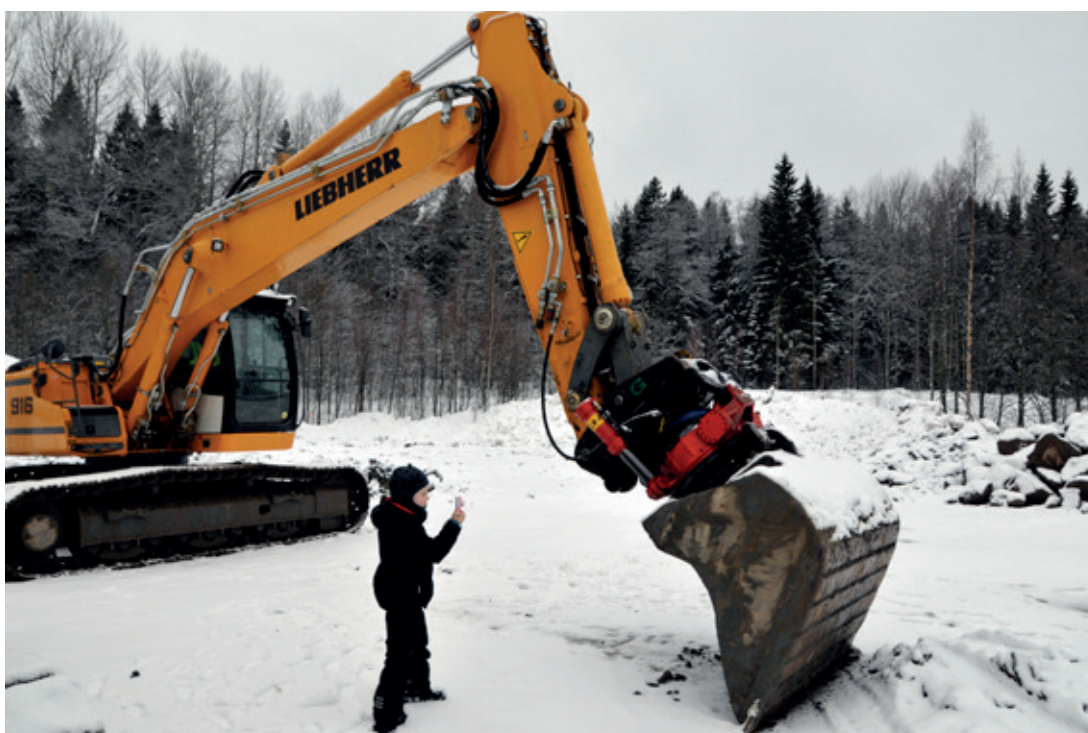
VALOKUVAAMINEN VAATII KESKITTYMISTÄ