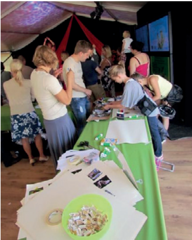
LASTEN TYÖPAJA "IHANNE LUONTOKERHONI"