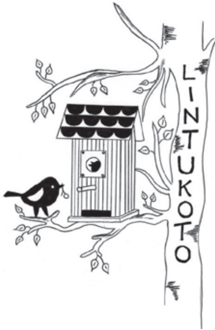
ILTAPÄIVÄKERHO LINTUKODON LOGO

"Asiakkaiden palautteet ja mielipiteet nousivat arvoonsa toiminnan suunnittelussa. Toiminnan tason pitäminen korkealla kannattaa alusta asti, puskaradio yleensä kantaa hedelmää ja ensimmäinen kerta määrittää pitkälle seuraavien kertojen asiakkaat."