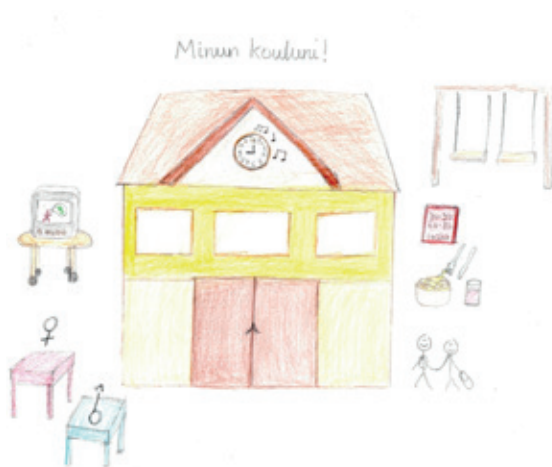
"MINUN KOULU" (TYTTÖ 8 V)

Kouluikäisten haastatteluissa toistuivat samat lapsille tärkeät teemat kuin päiväkotilapsillakin. Mukavaa koulussa oli kaverit ja leikkiminen sekä pelaaminen heidän kanssa ulkona. Lapset pitivät myös koulun kerhoista ja toivoivat niitä lisää, erityisesti sellaisia, joissa voinut oppia kädentaitoja kuten käsitöitä ja askartelua. Kouluympäristöön toivottiin enemmän värikkyyttä, lisää naulakoita ja tietokoneita sekä koulun soittokehoon "mukavampi" ääni, esimerkiksi "joku biisi". Suurimmat muutostoiveet lapsilla liittyivät koulu- ja opetusrauhaan. Toivottiin kiusaamisen vähenemistä, kuria oppitunneille, parempaa opetusta ja pienempiä luokkakokoja.