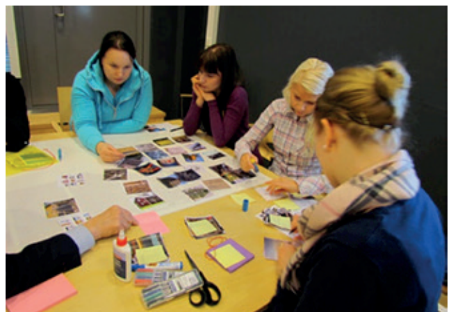
WORKSHOP TYÖSKENTELÄ PALVELUMUOTOILUN MENETELMILLÄ

Jatkuva palvelujen kehittäminen on jo nyt todellisuutta sosiaali- ja terveydenhuollon alalla. Resurssien vähetessä palvelujen tulee säilyä inhimillisiä ja laadukkaita. Yhteisen workshop työskentelyn avulla opiskelijat saivat ikäryhmittäin pohtia tulevaisuuden sosiaali- ja terveydenhuollon palveluja. Palvelumuotoilussa käyttäjän tai asiakkaan näkökulma on keskiössä ja käyttäjien inhimillinen toiminta, tarpeet, tunteet sekä motiivit ovat kokonaisvaltaisen ymmärtämisen perusta (Miettinen