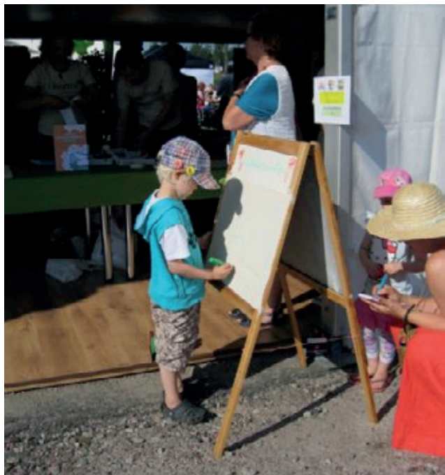
LAPSEN HAASTATELUTILANNE ASUKASTAHTUMASSA

Kouluii -hankkeessa toteutetun yhteisöpajan (Hägg, 2012) tuloksina saatiin kehittämiskohteeksi leikkipuistotoiminnan kehittäminen. Omnian aikuisopiston lähihoitajaopiskelijat keräsivät Parasta arkea -pilotille lisätietoa potentiaalisten leikkipuiston käyttäjien toiveista ja tarpeista yhdessä Suurpellon asukastahtumassa. Toiveista ja tarpeista kartoitettiin niin lapsilta kuin aikuisiltakin. Lasten haastattelut hyödyntäen piirustus-haastattelu – menetelmää. Lasten haastatteluja ja piirustuksia kertyi 12 ja lasten ikä vaihteli 1–12 vuotiaaseen. Lapset saivat piirustus- ja maalaustelineessä oli kaikille tyhjä A2 kokoinen piirustuspaperi.