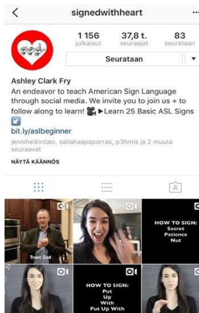
KUVA 1. Esimerkkikuva amerikkalaisesta viittomakieltä opettavasta Instagram-tilistä (Fry i.a.)

Opiskelumme alkuvaiheessa löysimme amerikkalaisen Instagram-tilin nimeltä Signedwithheart, jossa kuuro nainen opettaa amerikkalaista viittomakieltä videoilla. Kyseinen tili on julkinen ja täten avoin kaikille. Olemme saaneet siitä hyvää käyttäjäkokemusta ja täten osasimme ottaa eri asioita paremmin huomioon oman tilin perustamisessa. Esimerkiksi videoiden jaottelussa käytämme videoiden alussa kuvaa, johon tulee tumma pohja ja viitottu sana valkoisin kirjaimin. Tällöin käyttäjä näkee heti profiilin videoita selatesaan, mikä sana milläkin videolla on viitottu. Alla on kuva Signedwithheart-tilistä.