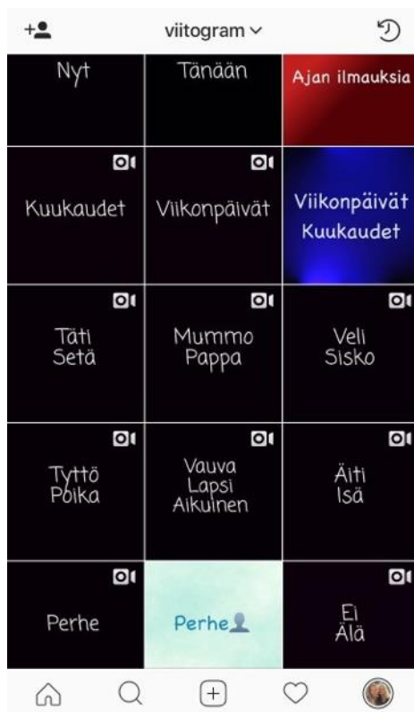
KUVA 3. Esimerkkikuva otsikkokuvista videoiden keskellä (Harmanen & Rasimus 2018.)

Luonnostelmavaiheen jälkeen arvostellaan ratkaisuluonnokset ja päätetään lupaavin luonnostelma, joka suunnitellaan yksityiskohtia myöten lopulliseksi toteutettavaksi palveluksi (Jokinen, 2001, 89). Päädyimme aihepiirien jaottelussa otsikoiden erottamiseen värien avulla. Numerointi osoittautui liian haastavaksi, sillä oppijan etsiessä viittomia eri aihepiireistä, hänen olisi pitänyt joka kerta palata ylös tilin esittelyosioon tarkistamaan aihepiiriin kuuluvat numerot, jonka avulla löytäisi viittomat. Otsikoiden jaottelu värien avulla on taas selkeämpi ja aihepiirit tulevat esille selauksen myötä. Alla esimerkkikuva siitä, millä tavalla otsikkokuvat helpottavat aihepiirien erottamista toisistaan.