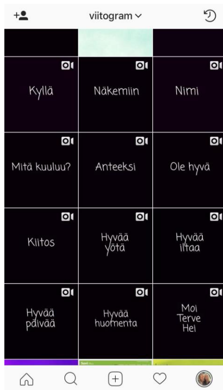
KUVA 2. Esimerkkikuva Instagram-tilin videoista (Harmanen & Rasimus 2018.)

Työstimme aihepiirejä työelämäohjaajamme kanssa ja häneltä saimme tietoa siitä, mistä aiheista viittomien opetus aloitetaan yleensä vasta-alkajien ollessa kohderyhmänä. Siksi aiheiksi valikoitui jokapäiväisissä arjen tilanteissa käytettäviä viittomia. Tavoitteenamme oli tehdä selkeä ja helposti selattava Instagram-tili, josta oppijan on helppo löytää etsimänsä aihepiiri ja siihen kuuluvat viittomat. Instagram-tilillä videot latautuvat peräkkäin, eli erinäisiä kansioita ei voi tehdä. Alla on esimerkkikuva siitä, millä tavalla videot näkyvät tilillä.