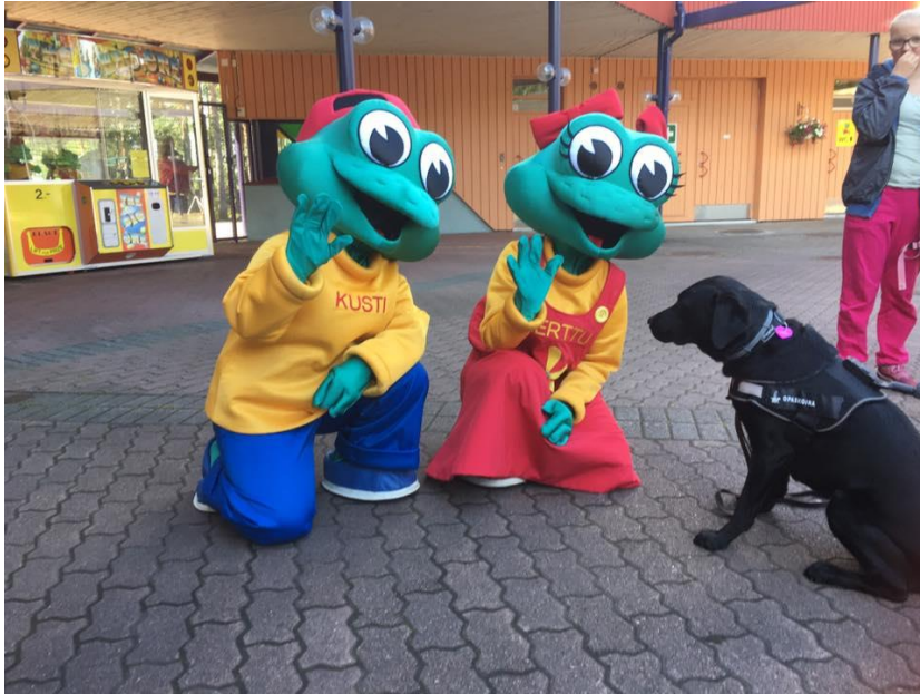
Kuva 3. Opaskoira Vilka Linnamäellä. (Opaskoira Vilka Facebooksivu 2017)

Opaskoiran yhteisöllisyyden merkitys on vahvistunut viimevuosina sosiaalisen median tarjoamien mahdollisuuksien osalta. Sosiaalinen media yhdistää opaskoirien käyttäjät muihin opaskoirien kanssa yhteydessä oleviin ihmisiin. Aikaisemmin yhteydenpito tapahtui sähköpostitse.