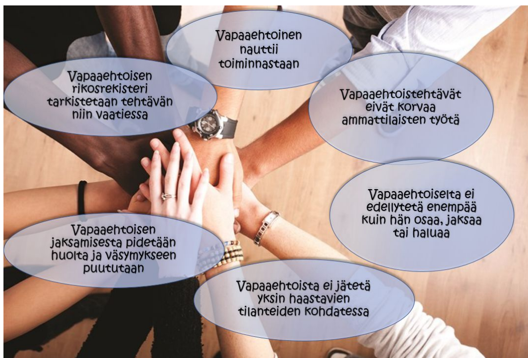
Kuvio 1. Vapaaehtoistoiminnan periaatteet

Vapaaehtoistoiminnan määritelmässä on alettu kiinnittää huomiota auttamisen lisäksi enemmän vapaaehtoistoiminnan organisoimiseen ja vapaaehtoisten omiin motiiveihin ja toiveisiin. Tämä näkyy muun muassa Antti Eskolan määritelmässä: