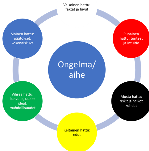
Kuva 1: De Bonon kuusi ajatteluhattua (Digitila, 2015)

paremmin yksilöä tuomaan näkökulmiaan esille. Tietyn roolin takaa voi olla helpompaa tuoda oma ääni kuuluville suuressa joukossa.