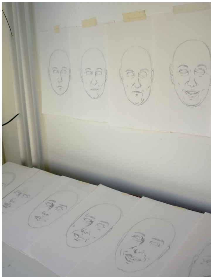
Kuva 5. Lopputyö työstämisvaiheessa

sarjaa, jolloin vältettiin ”neliö neliössä” -vaikutelmaa. Pleksin tilasin sen mukaan minkä kokoinen lopputuloksesta tuli.