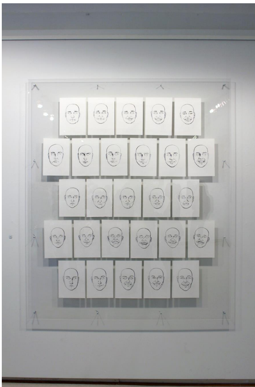
Kuva 6. Valmis lopputyö ripustettuna näyttelyssä Galleria Saskiassa

Viivapiirustuksessa minua kiehtoo, miten pienillä viivan muodon ja rakenteen muutoksilla voidaan välittää paljon informaatiota. Se on puhdasta ja rehellistä, sekä läsnä myös muussa työskentelyssäni. Piirustus on minulle kuvan tekemisen pohja, sekä kaiken alku. Aloitan aina työni huolellisella piirustuksella ja työskentelyni onkin ajoittain hidasta puurtamista, mutta huolellisen pohjatyöskentelyn ansiosta pääsen nauttimaan työn viimeistelystä ja fiilistelemään eri materiaaleja. Haluan jatkuvasti kehittää itseäni kuvan tekijänä, enkä halua päästää itseäni liian helpolla, sillä silloin en voisi tuntea ylpeyttä siitä mitä olen saanut aikaan.