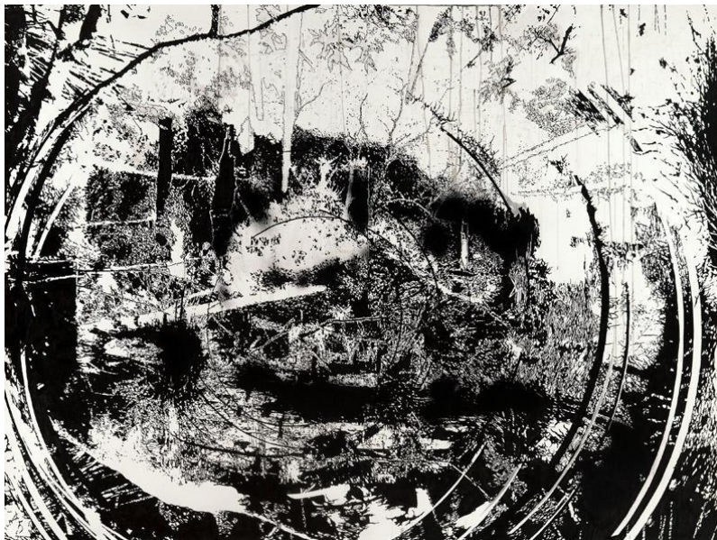
Kuva 3. Yehudit Sasportas, Shichecha no.6, 2012