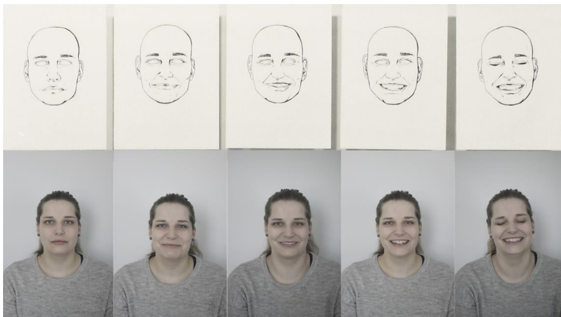
Kuva 4. Kuva lopullisista piirroksista ja valokuvasarja joihin piirustukset perustuvat

Malleina minulla oli lopputyössäni minulle tuttuja henkilöitä; läheisiä ja tuttavია. Kuvausessiot mallieni kanssa olivat todella lyhyitä. Kesto oli 5-15 minuuttia per malli. Asetin heidät valkoista seinää vasten ja käskin heidän pysyä mahdollisimman vakavina. Laitoin kamerasta sarjatulituksen päälle, sillä kuten arvelin, tuo kasvojen vakaavoittaminen aiheutti suurimmat nauruun purskahdukset ja yleensä ensimmäiset kuvat olivat parhaita. Seuraava vaihe oli karsia kuvamateriaalista 5-6 kuvan sarja, jonka pohjalta toteutin piirustukset. Aloitin piirustustyön minulle läheisimmistä henkilöistä. Kuvat syntyivät kuin itsestään ja huomasin, ettei mallikuvia tarvinnut hirveän orjallisesti tuijottaa.