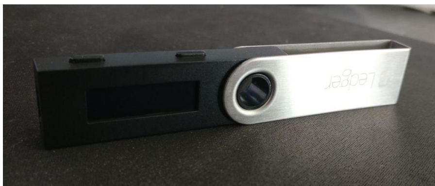
Kuva 1. Ledger Nano -laitteistolompakko

Lähes kaikissa paitsi pörssien lompakoissa on 12 tai 24 merkinen palautuskoodi, joka yleensä kirjoitetaan muistiin paperille. Koodilla lompakko voidaan palauttaa salasanan unohtuessa. Jos koodi ja salasana katoavat, lompakkoa on käytännössä mahdoton palauttaa ja käyttää.