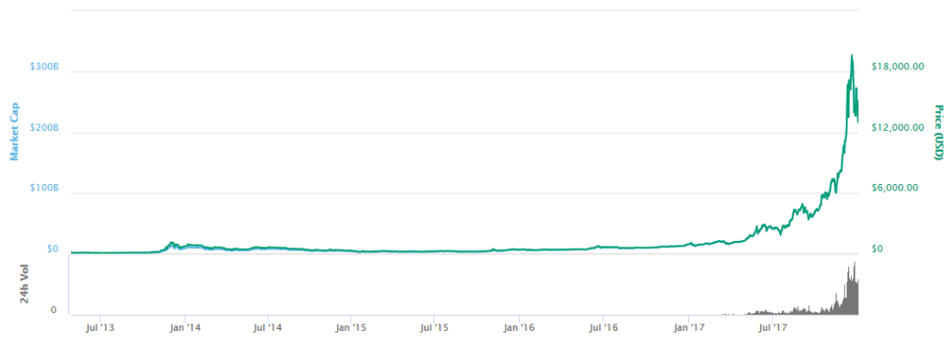
Kuva 5. Bitcoinin arvonkehitys vuonna 2017

Kuvassa näemme, että noin toukokuun kohdilla arvo alkaa nousta hitaasti, mutta suurin nousu tapahtuu päivissä, alkaen marraskuussa. Arvo on korkeimmillaan noin 19 500 dollaria, joka on euroissa noin 15 900 euroa käyttäen 11.2.2018 valuuttakursseja. Syitä suurelle arvonnousulle on useita, mutta todennäköisenä voidaan pitää sitä, että sijoittajat uskovat valuuttaan ja sen kasvuun, ja hakevat sillä tuottoa sijoitukselleen. Tätä voidaan pitää niin sanotusti seuraamuksena siitä, että jotkut sijoittajista lähtevät mukaan arvon ollessa matala, ja arvon noustessa muut sijoittajat seuraavat.