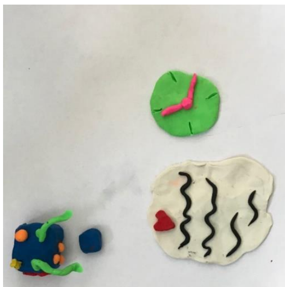
Kuva 5 Keksintöjä

Kun lahjat olivat annettu, siirryimme muovailuvahojen äärelle. Tarkoituksena oli suunnitella ja muovaila jokin uusi mullistava keksintö, jota vanhempi tarvitsee ja toinen sellainen, mistä lapsi hyötyisi. Keksintöjen ideoiminen ja muovailu sujui huumorisävytteisen keskustelun lo-massa. Äidit tuntuivat tuntevansa toisensa jo hyvin. Molemmat kuitenkin suunnittelivat kek-sintönsä itsenäisesti. Toinen äiti keksi pienen mietinnän jälkeen sellaisen keksinnön, jolla voisi jakaa itsensä kahtia niin, että toinen osa olisi lapsen kanssa ja toinen tekisi kotitöitä. Tämän keksinnön hän nimesi ajantasaajaksi. Äiti kertoi, että kokee aina huonoa omaa tuntoa, kun ei ole lapsen kanssa. Hänen toinen keksintönsä oli lapselle. Siihen oli koottu kaikki, mitä lapsi tarvitsee hyvään elämään. Äiti kertoi, että vaikka vanhemmat olisivat eronneet, lapsella olisi silti isä ja äiti ja kaikki tarvitsemansa. Hän nimesi keksinnön taatuksi tulevaisuudeksi. Toisen äidin keksintöjä olivat energialataamo, josta äiti voisi tankata energiaa tarvittaessa. Lasta varten hän loi keksinnön nimeltään ”säännöt ja rutiinit”, joita jokainen lapsi tarvitsee.