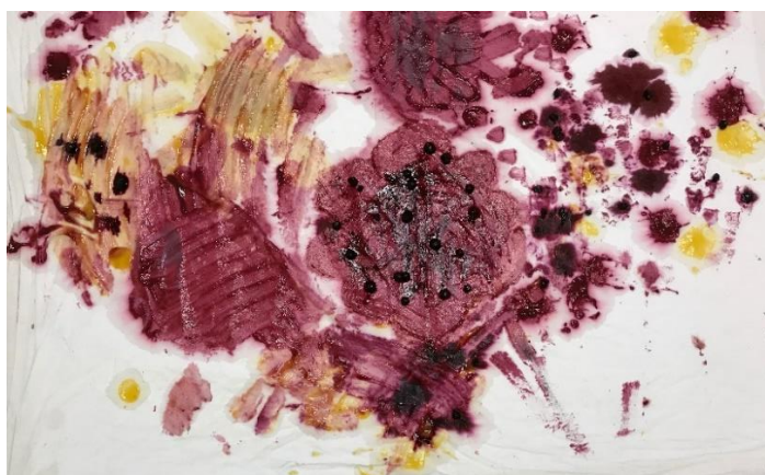
Kuva 4 Värikylpytuotos

Meille molemmille jäi tästä työpajasta hyvä mieli. Kun osallistujaperheitä oli vain kaksi, oli meillä ohjaajilla hyvää aikaa havainnoida. Jos perheitä olisi ollut viisi, olisi meidän ollut jo paljon haastavampaa havainnoida toimintaa. Lapset olivat tähän toimintaan hyvän ikäisiä, eivät liian pieniä tai isoja. Heillä oli myös tilaa temmeltää. Olisi ollut varmasti haastavampaa värikylpeä isommalla porukalla, koska silloin isompien lasten olisi pitänyt jatkuvasti varoa askeliaan ja äitien olla valppaana. Tämä työpaja antoi siis ehkä ihanan rauhoittumishetken näille vanhemmille, kun heidän lapsensa saivat paistatella kahdestaan valokeilassa tällä kertaa.