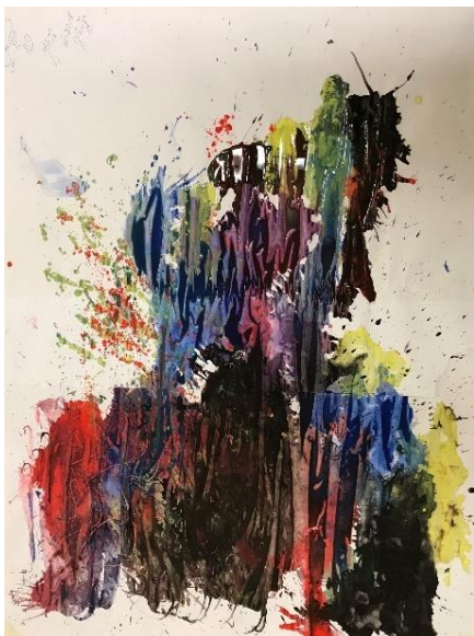
Kuva 2 Yhteen hiileen puhaltaminen

jääneet tunnevärit ja jaoimme äideille pillit. Kannustimme heitä nyt puhaltamaan yhteen hiileen, koska niin perheet tekevät, ja tässä tapauksessa äidit. Jokainen väri edusti siis eri tunnetta ja maalit sekoittuivatkin hienosti teoksessa tuoden esille sen, kuinka tunteetkin voivat vaihdella nopeasti. Äidit innostuivat pilleillä puhaltamisesta kovasti ja teoksesta tuli kaikkien mielestä todella hieno. Meidän piti välillä rauhoittaa tilannetta, jotta äidit muistaisivat hengittää välillä. Äidit antoivat teokselle nimen ”Minuutti ja mieli”, koska erästä äitiä lainaten, tunteet menevät heillä kuin vuoristorataa, ja mieli muuttuu minuutissa.