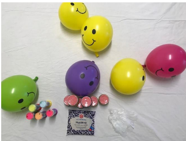
Kuva 3 Värikylymateriaalit

Toinen äideistä, äiti A kertoi lapsensa olevan hitaasti lämpenevä, ja molemmat lapset tankkasivatkin hellyyttä ja lohdutusta äitiensä sylissä hetken ja katselivat ilmapalloja kaukaa. Äiti A vaikutti olevan hieman hämillään siitä, että lapsi ei kiinnostunut ilmapalloista, vaan halasi äitiään tiukasti. Hetken päästä tämä lapsi juoksi pitkin salia. Kerroimme äiti A:lle, että on hyvä antaa lapsen tutustua vieraaseen tilaan ja antaa hänelle mahdollisuus juosta tilaa ympäri. Ajoittain tämä lapsi juoksi takaisin äitinsä luo ja suukotteli häntä. Pikkuhiljaa hän alkoi myös ottamaan kontaktia meihin ohjaajiin ja hymyilemään meille. Tarjosimme ilmapallojen lisäksi saippuakuplia, joista tämä äiti A:n lapsi innostui hetkeksi.