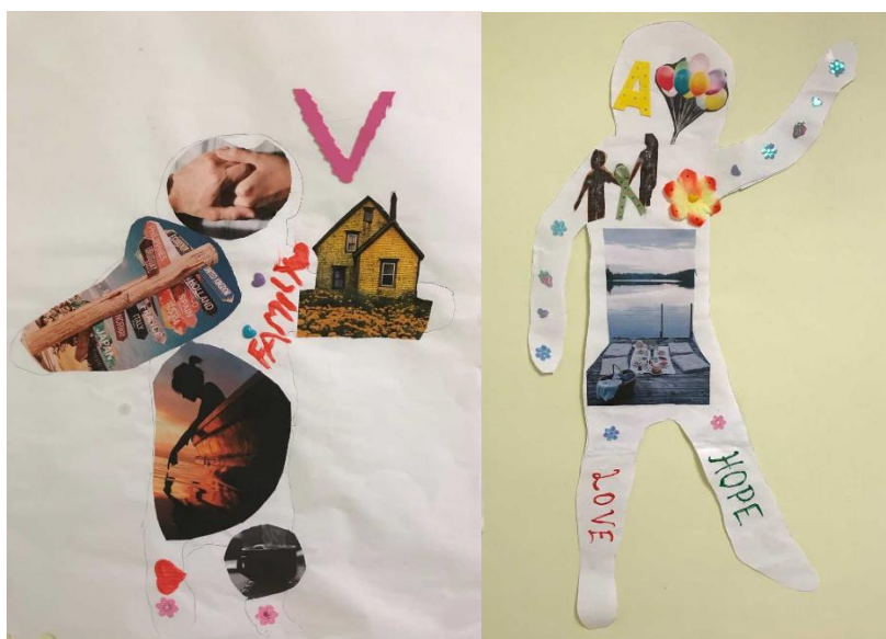
Kuva 6 Haavetaulut lasten ääri viivoista