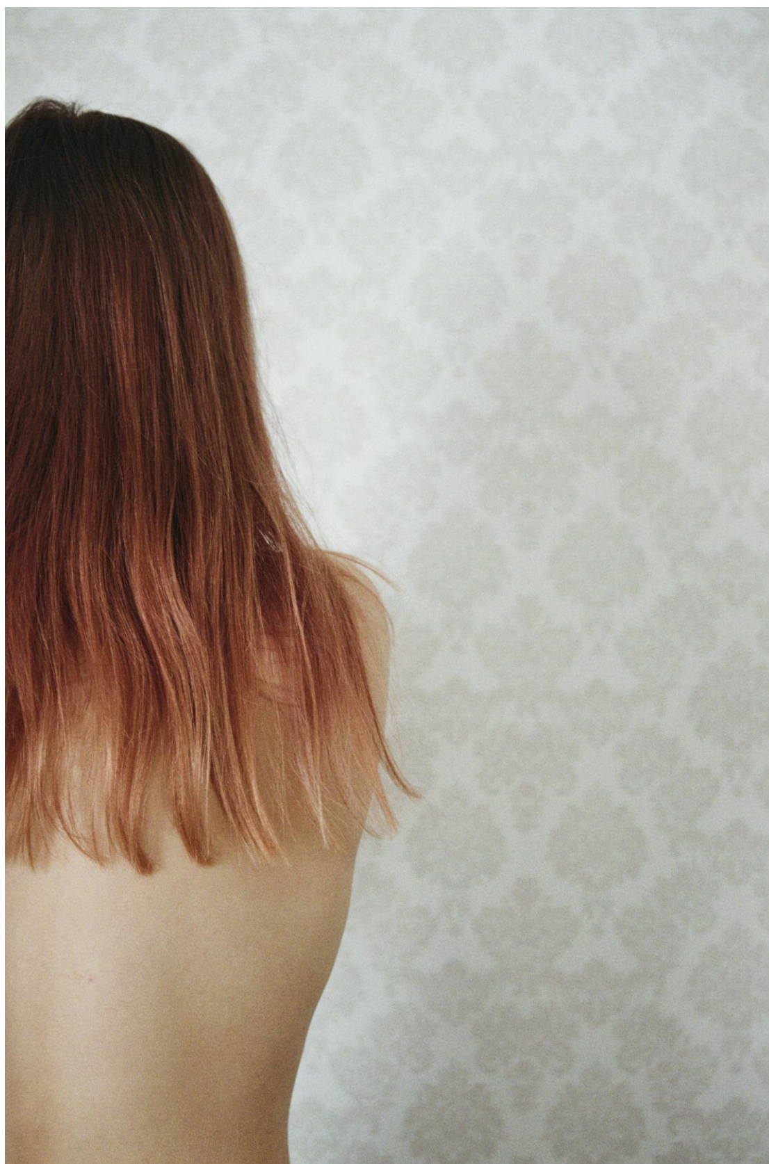
Kuva 1. Mermaid Hair.