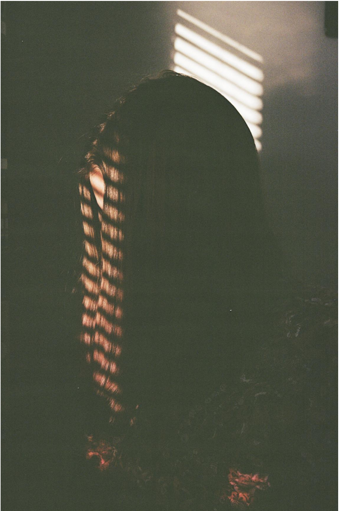
Kuva 3. Baby You Rock Me.