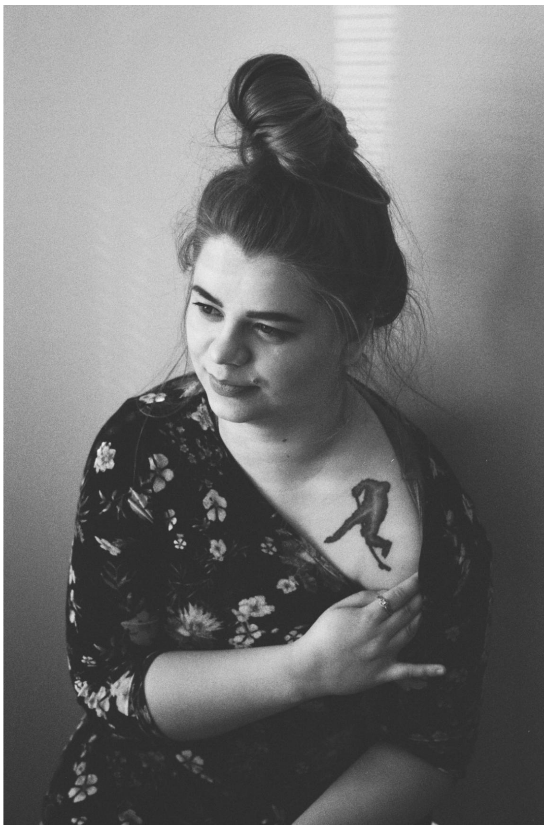
Kuva 7. Riddle.