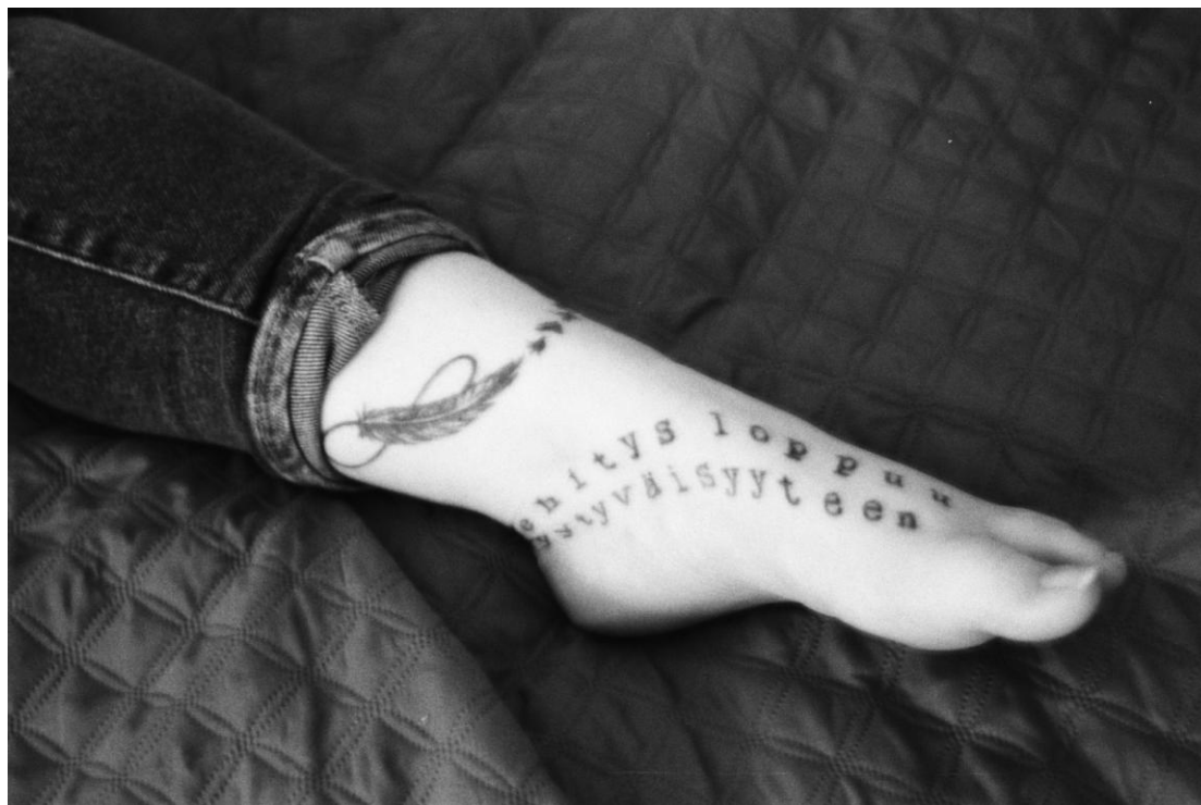
Kuva 8. Written In Skin.

Kuvaustilanne toimitettiin melko hämärässä asunnossa yövalon avulla. Tämä olikin valaistuksen osalta yksi haastavimpia kuvauksia, mutta samaan aikaan varsin mielenkiintoinen tilanne. Keskustelimme mallin kanssa siitä, miten kaikissa kuvissa ei tarvitse näkyä välttämättä kuin jokin raaja, mikäli se sopii mallin ajatuksiin ja ilmentää niitä jollain tapaa. Tatuointien merkitys on vahva, joten päädyimme kuvaamaan mallin jalkaterää. Oli selvää, että paljastamme pääosassa olevan tatuoinnin lisäksi myös toisen samassa jalassa olevan tatuoinnin – niinpä malli kääri farkkujensa lahkeet ylös. Ohjasin lähinnä nilkan asentoa, joka loppujen lopuksi ojentuikin kivasti itsestään.