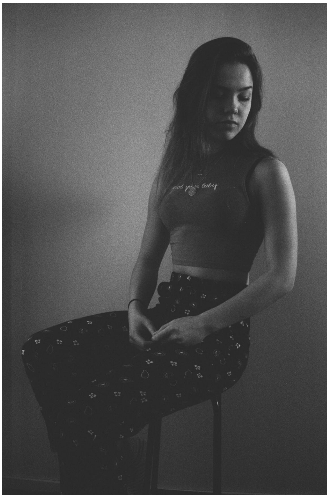
Kuva 2. Not Your Baby.