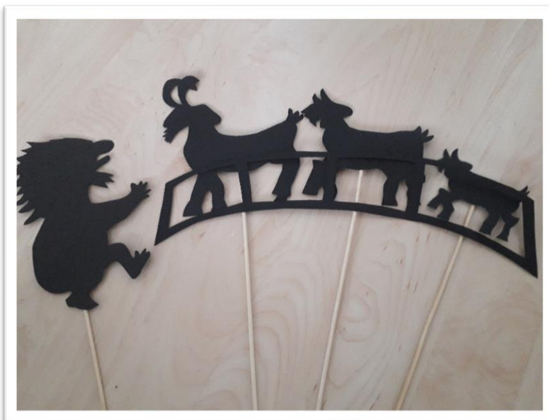
Kuva 1 Varjoteatterinukkeja

Materiaalipaketin alkuun päätimme laittaa tietopaketin draamakasvatuksen ja nukketeatterin tärkeydestä ja merkityksestä varhaiskasvatuksessa, jotta työntekijät voivat sen avulla muistuttaa itseään niiden tärkeydestä. Tietoiskun jälkeen laitoimme materiaalipakettiin tarinat, joita oli lopullisessa materiaalipaketissa yhteensä 19. Jokainen tarina sisälsi seuraavat asiat: tarinan nimen, alkuperäisen kirjoittajan, teatterimuodon, teeman,