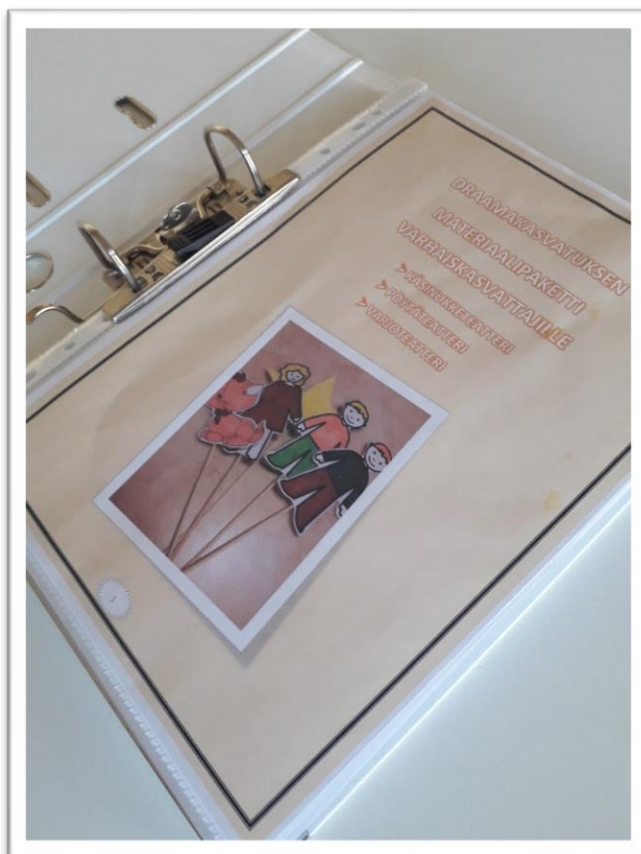
Kuva 4 Kansilehti