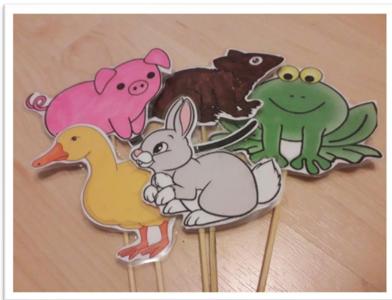
Kuva 2 Pöytäteatterinukkeja