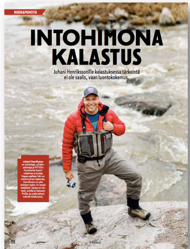
Kuva 3: Artikkelin Intohimona kalastus, julkaistiin K-Ruoka-lehdessä 4/2017. (Liite 10)

Minulle kyseisessä jutussa merkitsi eniten se, että olin onnistunut kirjoittamaan jutun, joka kertoi hyvän tarinan eli palveli lukijaa sekä samalla toi esiin Fazerin brändimielikuvaa. Se,