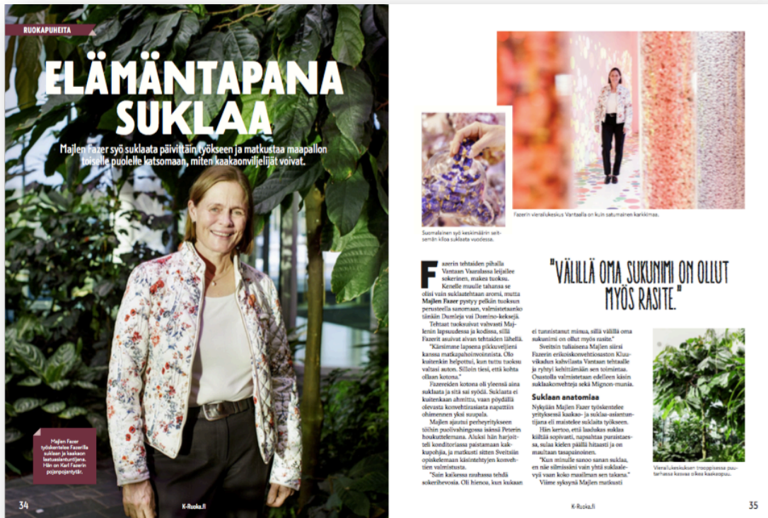
Kuva 4: Artikkelin Elämäntapana suklaa, K-Ruoka-lehdessä 2/2018. (Liite 11)

että pystyn aina seisomaan sanojeni takana, oli sitten kyse mistä aiheesta tai julkaisusta tahansa, on noussut minulle erittäin tärkeäksi ohjenuoraksi työssä.