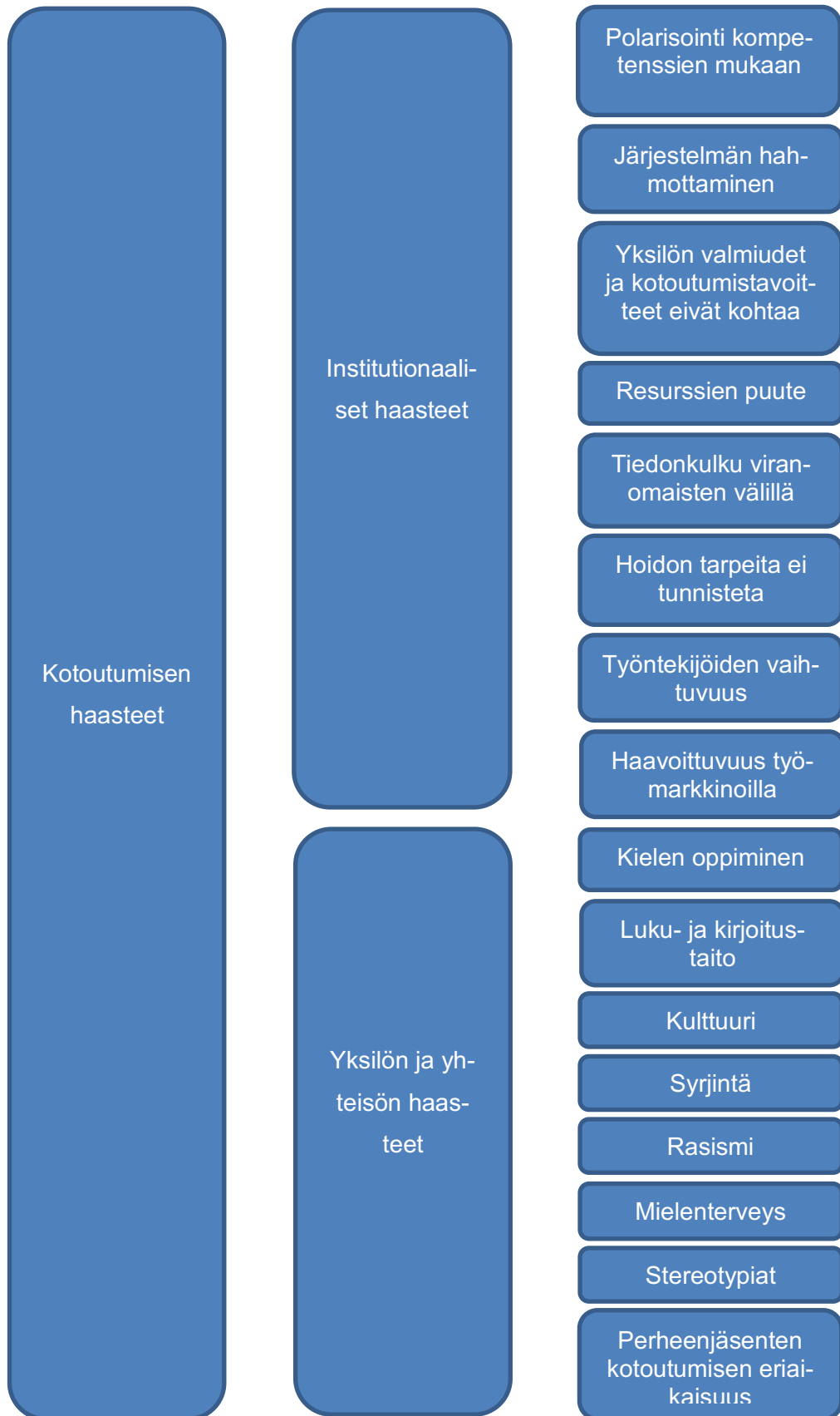
Kuvio 3. Temaattinen kartta