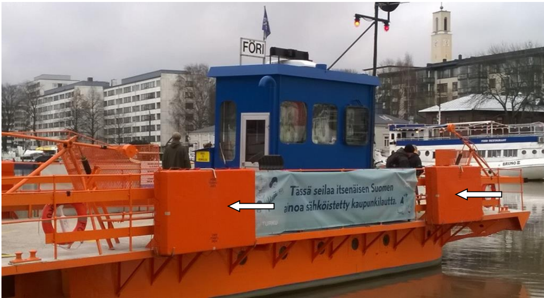
Kuva 1. Förin kelluntavälineet. (Kuva: Mari Junkkari).

Liikenteen turvallisuusvirasto Trafi edellyttää, että työnantaja järjestää uudelle työntekijälle opastavan perehdytyksen lossinkuljettajan tehtävään ennen työn aloittamista. Perehdytyksen tulee sisältää myös aluksen hengenpelastusvälineiden käyttö. (Salminen 2017).