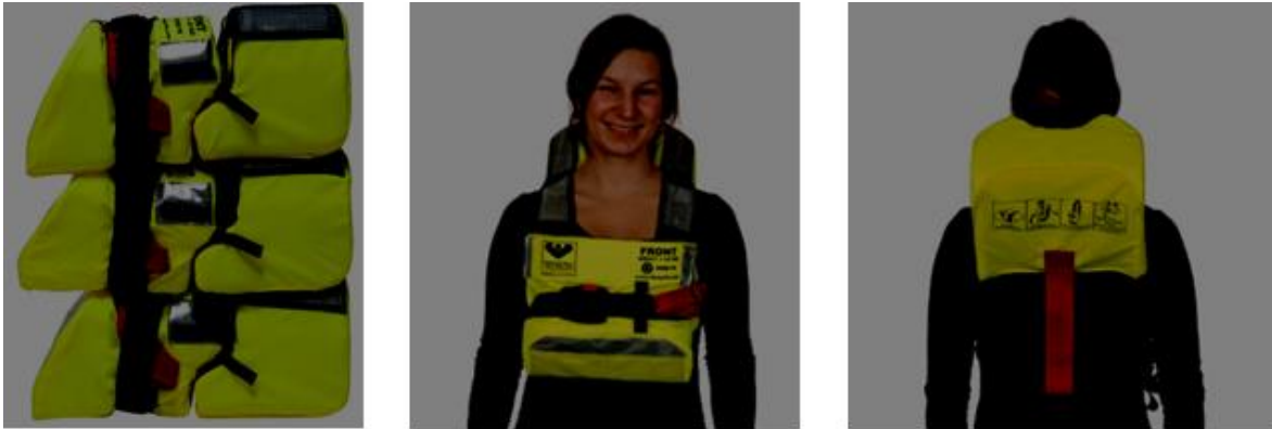
Kuva 2. Vikingin SOLAS-pelastusliivi.

pinnalla pitäminen ja oikein päin kääntäminen, ovat edelleen samat, mutta Aallon mukaan entistä helppokäyttöisempiä liivimalleja on jo varmasti olemassa. Laitio esittelikin uutta kevyttä ja kätevästi pienehköön tilaan pakattavaa pelastusliivimallia, joka kiinnitetään vyötärön yläpuolelta yhdellä kiinnitysnauhalla (Kuva 2). Paketti piti ensin purkaa avaamalla kiinnitysnauha ja sivuilla olevat kiinnitysnaurut, mutta liivi oli suhteellisen helppo pukea päälle pusakan tapaan. Liivi tuntui tukevan niskaa hyvin ja muotoilunsa ansiosta se päällä vaikutti olevan helppo liikkua ja toimia.