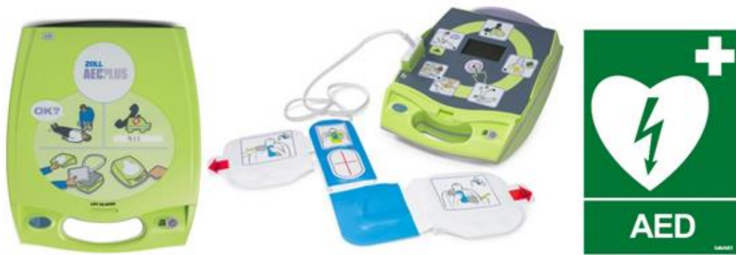
Kuva 4. Zoll AED Plus puoliautomaattinen defibrillaattori; defibrillaattorin opastekyltti.

sairaustapauksesta välitty nopeasti; toisaalta myös tieto mahdollisesta ilkeivallasta saadaan heti.