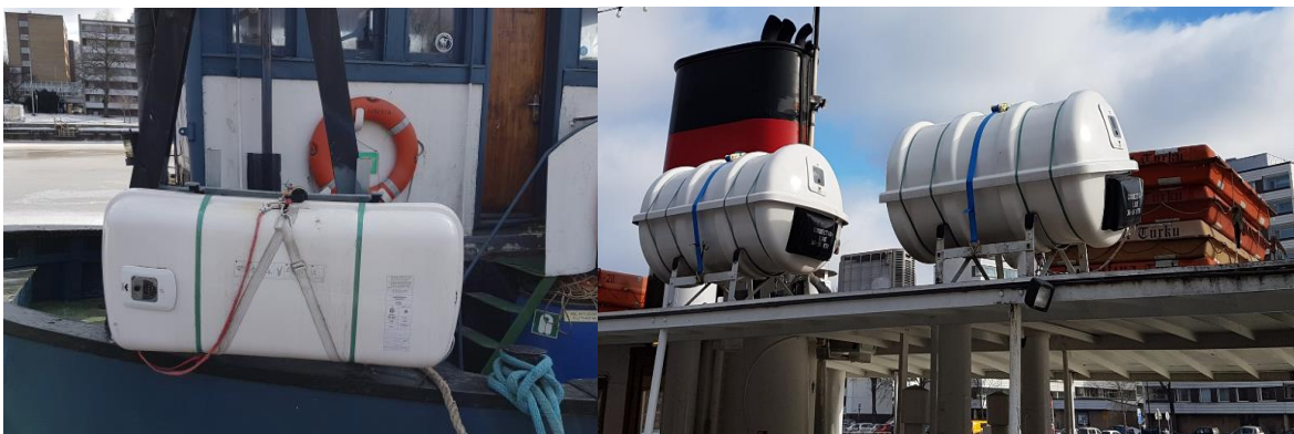
Kuva 6. Esimerkkejä pelastuslautoista paikoillaan aluksessa. (Kuva: Mari Junkkari).

Laitio korosti vielä, että vastuu lautan laukaisusta on ehdottomasti oltava etävalvontakeskuksella; on mahdoton ajatus, että matkustajille annettaisiin vastuu lautan käyttämisestä.