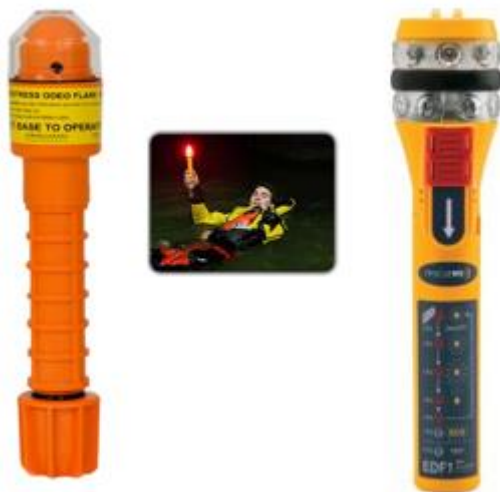
Kuva 3. Odeo Flare Mk3 pun LED soihtu ja rescueME EDF1 elektroninen hätäsoihdu. (Lähteet: https://www.marnela.com/product/130-55036 , https://www.marnela.com/product/1304-01710 ).