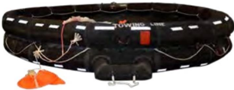
Kuva 5. Esimerkki avopelastuslautasta (malli Viking DKR/Viking IBA). (Lähde: http://ipaper.ipapercms.dk/VikingLife/Brochures/Cargo/MaritimeSafetyCatalogue/?page=18 ).

parhaita ratkaisuja, koska niiden avulla evakuoidaan veden kautta. Pelastuslauttojen osalta järjestelmän tulisi olla automaattinen: lautat olisi voitava laukaista nappia painamalla tai kahvaa vetämällä; mahdollisen kiinnitysnarun irrotus tulisi tapahtua automaattisesti tai valvomosta. Myös pelastusrenkaiden tulisi lauaa automaattisesti tai ne tulisi voida laukaista kauko-ohjatusti. Myös Laitio luopuisi kelluntavälineistä; hän kyseenalaisti, voidaanko kelluntalauttaa, jossa roikutaan narun päässä kylmässä vedessä edes pitää pelastusjärjestelmänä. Kotimaa I -alueella voitaisiin hyvin käyttää katottomia avopelastuslauttoja, jotka kääntyvät aina automaattisesti oikeinpäin (Kuva 5). Ne on helppo laukaista yhdestä pullosta ja niiden etuna on myös se, että iso lautta saadaan pakattua pieneen tilaan (esimerkiksi katoton 50 hengen lautta mahtuu samaan tilaan kuin katollinen 25 hengen lautta).