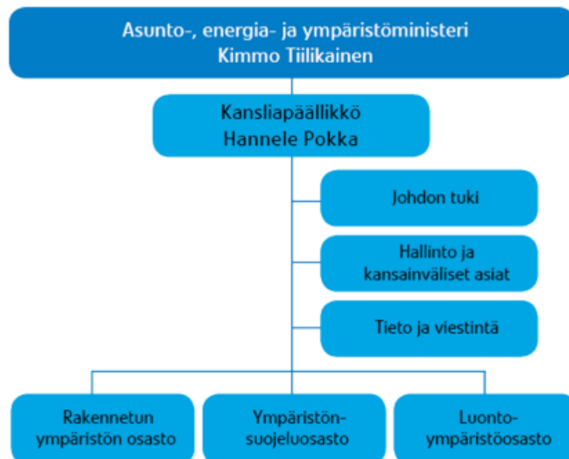
Taulukko 1. Ympäristöministeriön organisaatiokaavio (Ympäristöministeriö 2013a)

Ympäristöministeriötä johtaa asunto-, energia- ja ympäristöministeri. Ylimpänä virkamiehenä toimii kansliapäällikkö. (Ympäristöministeriö 2013a) Ministeriössä työskentelee noin 250 henkilöä monipuolisissa tehtävissä, joista yleisimpiä ovat säädösvalmistelun, ympäristö- ja asuntopolitiikan sekä hallinnon tehtävät (Ympäristöministeriö 2013b).