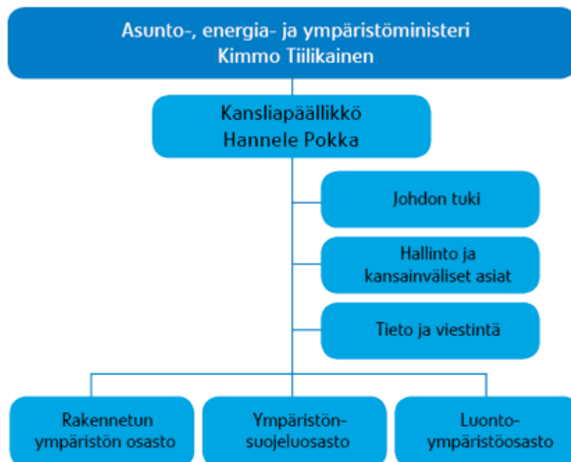
Taulukko 1. Ympäristöministeriön organisaatiokaavio (Ympäristöministeriö 2013a)

Ympäristöministeriötä johtaa asunto-, energia- ja ympäristöministeri. Ylimpänä virkamiehenä toimii kansliapäällikkö. (Ympäristöministeriö 2013a) Ministeriössä työskentelee noin 250 henkilöä monipuolisissa tehtävissä, joista yleisimpiä ovat säädösvalmistelun, ympäristö- ja asuntopolitiikan sekä hallinnon tehtävät (Ympäristöministeriö 2013b).