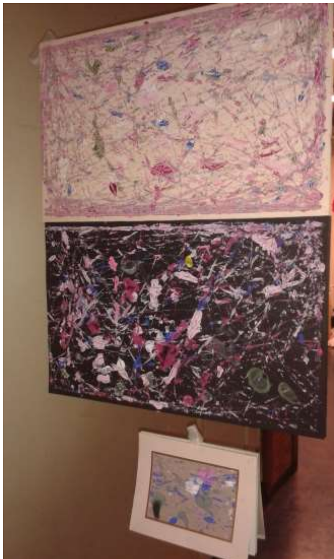
Kuva 3. Kuulamaalauksia.

heen sisäinen kommunikaatio toimi ja oltiin kerrankin niiden asioiden äärellä, mitä ryhmätöinnillä tavoittelimme. Ryhmäkerrassa oli valintoja, niiden äärellä pysähtymistä ja yhteistä neuvottelua vanhemman ja lapsen välillä, sekä yllätyksellinen lopputulos joka ilahdutti.