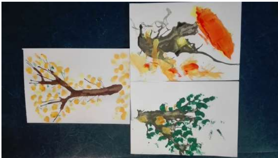
Kuva 2. Ensimmäinen toimintakerta.

tävä puun runko oli hieman haasteellinen, mutta työt kyllä etenivät. Valmiista töistä pidettiin, ne asetettiin katseltavaksi niin että vanhemman puu oli lapsen puun “heijastus” sekä erikseen. Arvostuskierrros meni kohtuullisesti - sanoitimme itse malliksi töitä. Saimme hyvää palautetta lapsilta ja saimme kerrottua lyhyesti ryhmän tarkoituksesta. Jätimme liitutaalulle Silkinportissa yhteystietomme ja iloiset terveiset, että ryhmään mahtuu vielä mukaan.