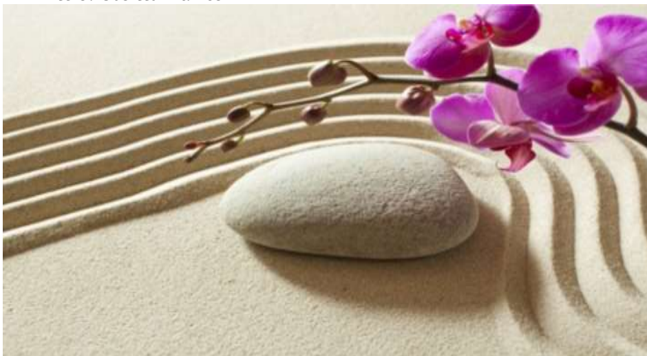
Liite 5. Uusittu mainos

KOHTAAMISTAITEEN RYHMÄ SILKINPORTIN TOIMINTAKESKUKSESSA, Tikkurilantie 44 F, 2. kerros.